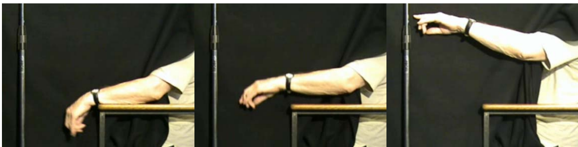
Abbildung 3 a

Bewegung erfolgte nach der Fahn- bzw. der Tremorsuppressionsskala zeitgleich zur Videoaufnahme. Für Test 2 wurden die Probanden gebeten, nachdem erneut versucht wurde einen Ruhetremor hervorzurufen, den tremordominanten Arm auf Schulterhöhe anzuheben und dann mit dem Zeigefinger auf eine in etwa 20 cm Abstand vor ihnen senkrecht zum Boden aufgestellte Stange zu zeigen. Die Lokalisation der Stange wurde von den Probanden zuvor ertastet bzw. konnte visuell kontrolliert werden, da die Stange über die künstliche Trennwand hinausragte. Das Tremorverhalten wurde analog Test 1 und simultan zur Videoaufnahme bewertet. Der Versuchsaufbau ist in den Abbildungen 3 a- c demonstriert.