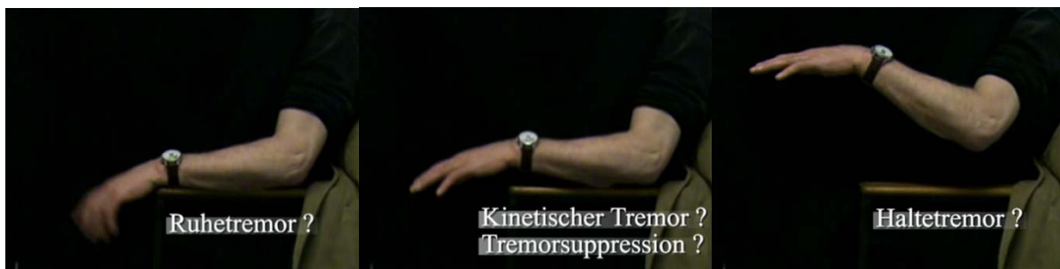
Abbildung 2 a

Zur Beurteilung des Verhaltens des Ruhetremors bei Bewegungsbeginn wurden zwei Untersuchungsgänge durchgeführt. Nach einer Provokationsdauer von 30- 60 Sekunden wurden die Patienten, unabhängig davon, ob sich ein stabiler Ruhetremor eingestellt hatte oder nicht, aufgefordert, beide Arme mit mittlerer Geschwindigkeit bis in Schulterhöhe anzuheben, und dann auf dieser Höhe ein paar Sekunden zu verharren. Dieses Anhebemanöver ist im folgenden als Test 1 definiert.