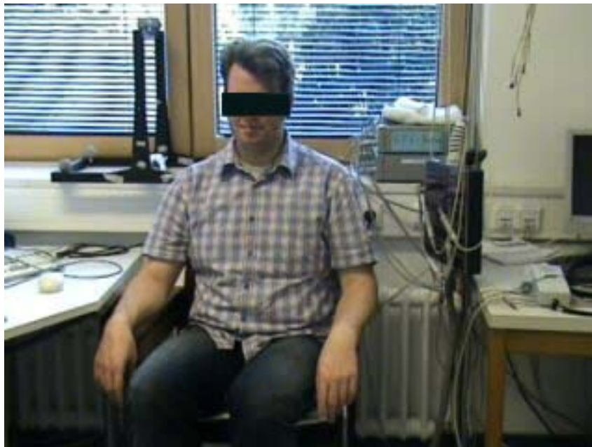
Abbildung 1: Setting zur klinischen Bewertung des Ruhetremors am Beispiel eines Probanden. Die Probanden saßen entspannt auf einem Lehnstuhl, wobei die Unterarme auf den Lehnen abgestützt waren, und die Hände frei über der Kante hinunterhingen.

Zur Untersuchung des Ruhetremors durch den erfahrenen Neurologen saßen die Probanden in einem bequemen Lehnstuhl, die Unterarme waren in Pronationsstellung auf den Armlehnen abgelegt, so dass die Hände in vertikaler Richtung frei hinunterhingen, so dass willkürliche Muskelkontraktionen vermieden wurden (Abbildung 1). Durch Rückwärtszählen in siebener Schritten wurde versucht einen Ruhetremor zu provozieren. Mit Ausnahme des psychogenen Tremors kann ein Tremor durch diesen mentalen Stress ausgelöst oder verstärkt werden [60; 61; 98]. Die größte erreichte Tremoramplitude wurde anhand der Fahn-Skala bewertet und notiert.