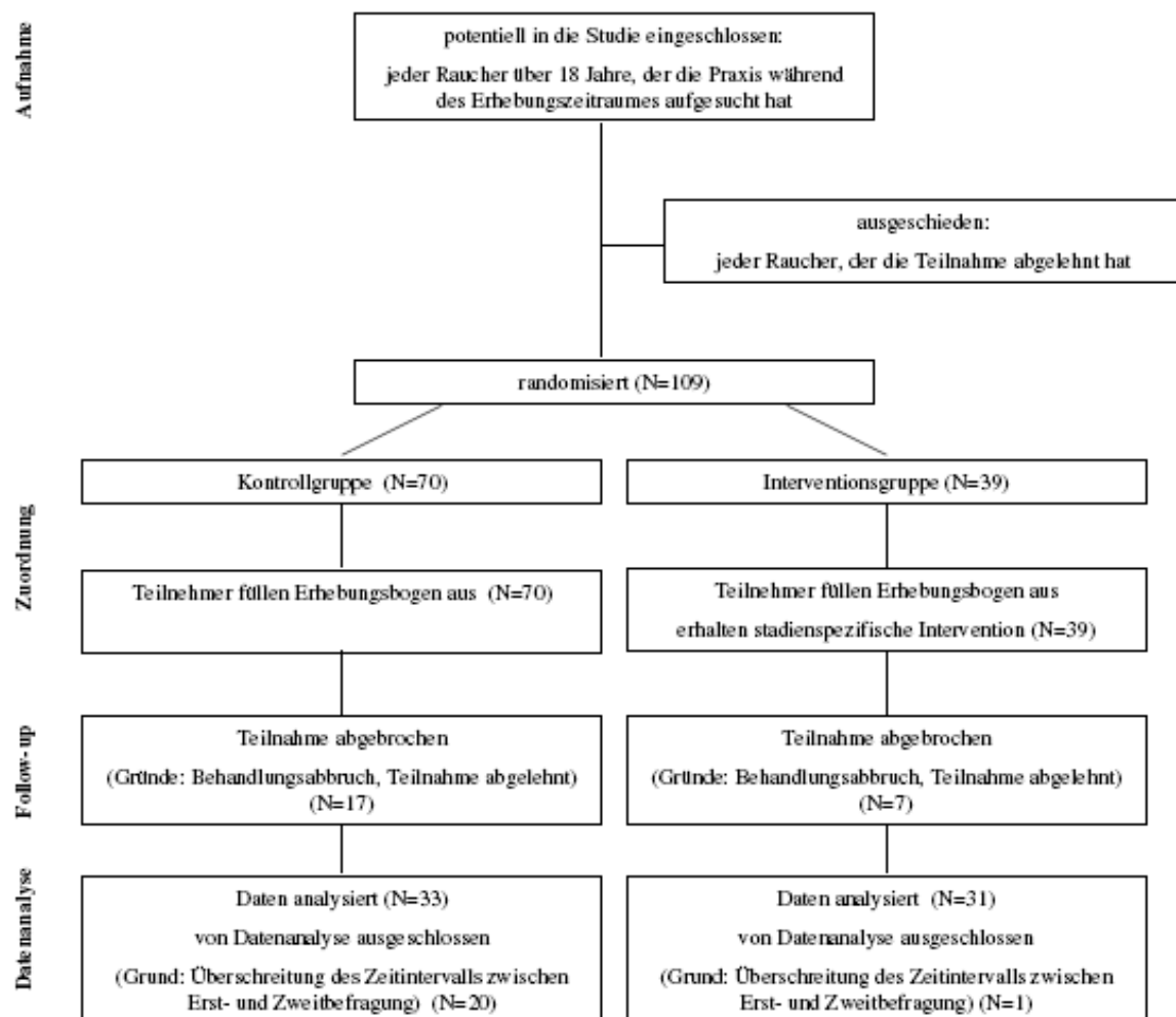
Abbildung 2: Flussdiagramm über ein- und ausgeschlossene Teilnehmer

180-244). Dieser Unterschied von 27 Tagen oder knapp einem Monat zwischen den Gruppen ist statistisch noch signifikant ( t(62)=5,00 ; p=0,000 ), jedoch überlappen sich die Intervalle der beiden Gruppen nun sehr viel stärker und die Differenz im Intervall konnte halbiert werden. Die Darstellung der Ergebnisse der zweiten Befragung sowie des Verlaufs zwischen den Befragungen bezieht sich daher auf diese reduzierte Stichprobe von insgesamt 64 Patienten. Eine Übersicht über die ein- und ausgeschlossenen Teilnehmer gibt das folgende Flussdiagramm.