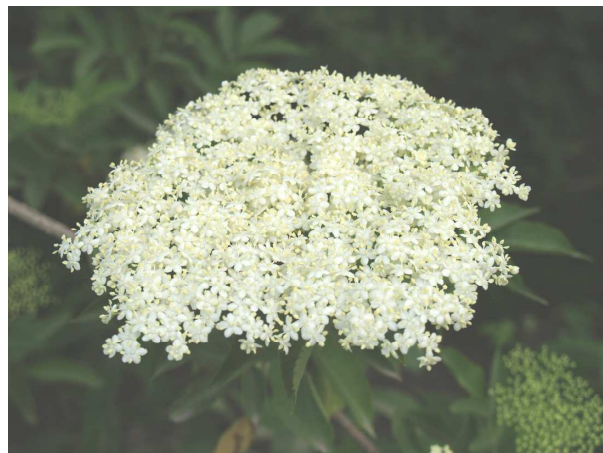
Abb, 2 : Schwarzer Holunder ( Sambucus nigra ), links die Beeren, rechts ein Blütenstand.