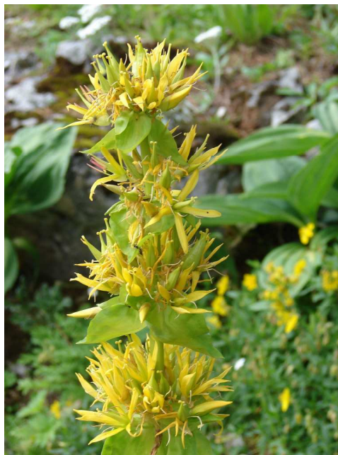
Abb. 7 : Gelber Enzian ( Gentiana lutea )