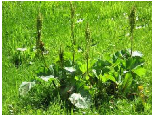
Abb. 4 :Gartensauerampfer ( Rumex acetosa )

Bei Rumex acetosa , dem Sauerampfer, handelt es sich um eine weit verbreitete, auf vielen heimischen Wiesen vorkommende Pflanze aus der Familie der Knöterichgewächse (Polygonaceae). Er wächst aufgrund seiner Vorliebe für nährstoffreiche Böden vor allem auf gegüllten landwirtschaftlichen Flächen. Er war schon in der Antike als Heilpflanze bekannt und beschrieben. Schon Dioskurides erwähnt in seiner Materia Medica aus dem ersten Jahrhundert n. Chr. die Wirkung des Ampfers. Er beschreibt die Anwendung der in Wein gekochten Wurzeln des Sauerampfers als Mittel gegen Ohren- und Zahnschmerzen (Dioskurides 1). In der aktuellen Literatur finden sich wenige Artikel, die sich mit der antibakteriellen Wirkung des Sauerampfers befassen. Lediglich eine cytotoxische und antimutagene Wirkung eines methanolischen Auszugs aus Sauerampfer wurde von Lee et al. nachgewiesen. Sie hatten vier Anthrachinone aus Rumex acetosa isoliert und diese auf ihre Wirksamkeit gegenüber einigen Tumorzelllinien überprüft. Zumindest einer der extrahierten Wirkstoffe zeigte hier eine cytotoxische Wirksamkeit. Weiter wies das Anthrachinon eine schützende Wirkung gegenüber der DNA-verändernden Wirkung des Mutagens 4-Nitro-o-phenylenediamin (NPD) auf (Lee et al., 2005).