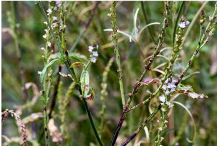
Abb. 6 : Echtes Eisenkraut (Verbena officinalis )

Das Echte Eisenkraut ( Verbena officinalis ) entstammt der Familie der Eisenkrautgewächse (Verbenaceae) und ist weltweit verbreitet. Es findet bereits in den Aufzeichnungen von Hippokrates aus dem fünften Jahrhundert v.Chr. Erwähnung als Heilmittel (Fuchs, 1900). Auch Dioskurides beschreibt in der Materia Medica das Eisenkraut als Mittel gegen Entzündungen (Dioskurides 2).