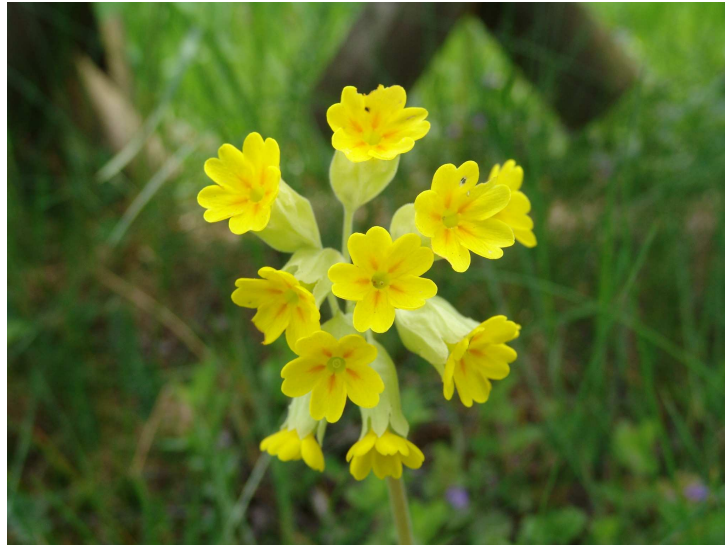
Abb. 5 : Blüten der Schlüsselblume ( Primula veris )

Die Schlüsselblume aus der Familie der Primelgewächse ( Primulaceae ) ist in Mitteleuropa beheimatet. Sie gehört im Frühjahr zu den ersten blühenden Wiesenblumen. Ihren Namen verdankt die Schlüsselblume der Ähnlichkeit ihrer Blütendolden zu einem Schlüsselbund.