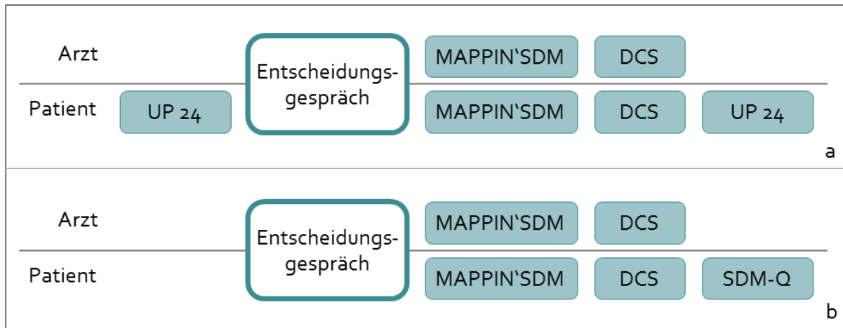
Diagramm 2: Ablauf des Fragebogeneinsatzes für ein medizinisches Entscheidungsgespräch, das auf Video aufgezeichnet wurde a) in einem Zentrum mit schwer erkrankten Patienten, b) in einem Zentrum mit weniger schwer erkrankten Patienten (z.B. zahnärztliche Prothetik) oder Gesunden (z.B. Geburtshilfe), nach Liethmann, 2014.