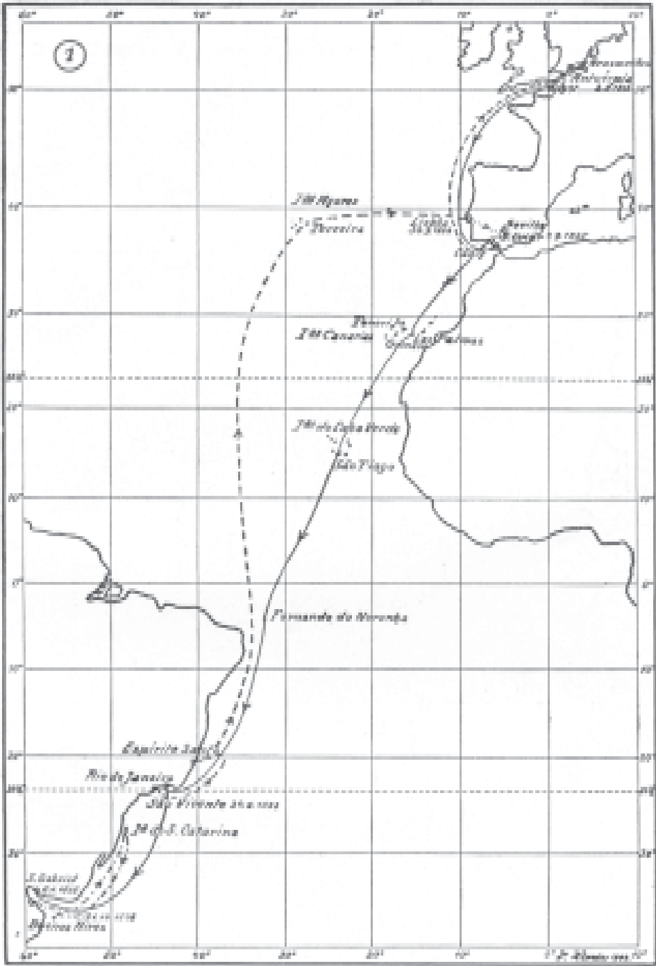
Die Seereisen Schmidels