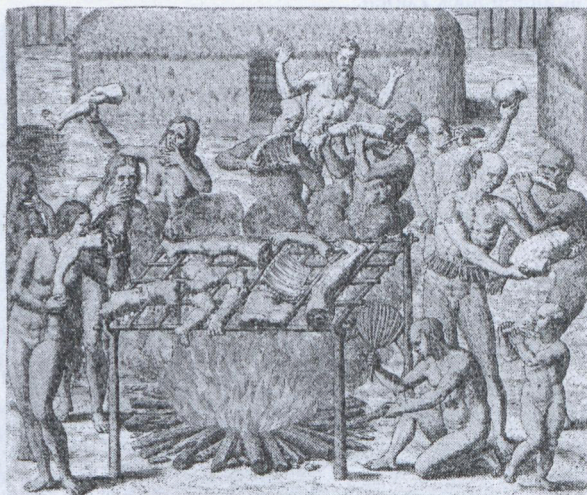
3. Theodor de Bry: America , Bd.3, latein 1592, deutsch 1593, Kupferstich zu Léry mit einer Kannibalismusedarstellung.