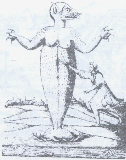
6. Magalhães de Gândavo: Brasilianisches Meeresungeheuer in: Historia da provincia Sancta Cruz , Lisboa 1576.