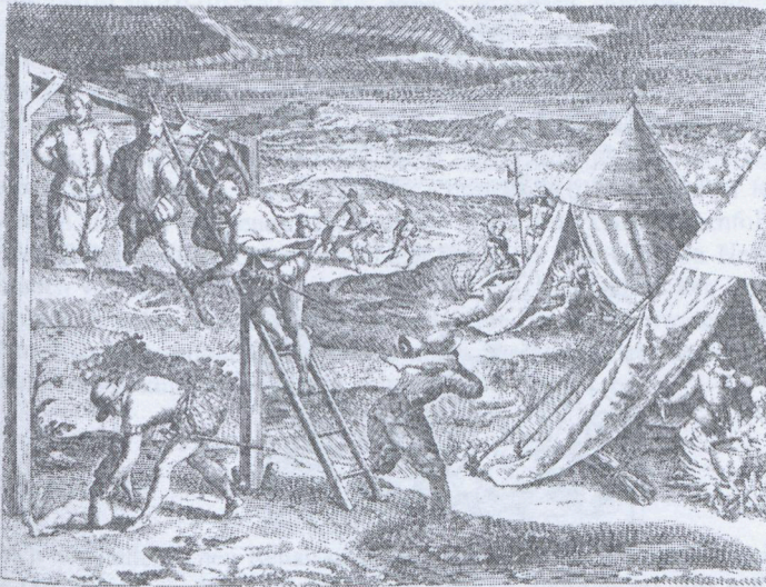
7. Theodor de Bry: America , Bd.7, 1597, Ulrich Schmidel, Kannibalismus bei den Europäern.