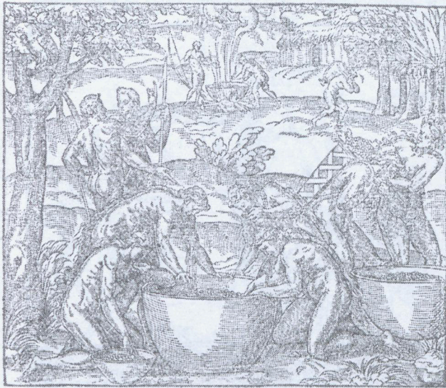
2. Thevet: Cosmographie 1575, Herstellung von Caouin, man beachte das volle Haupthaar der Männer und die idealisierten Körperhaltungen.