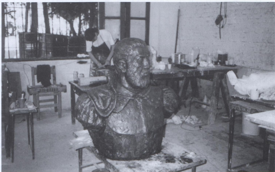
Die Neuerstellung der Büste des Schmidel-Denkmals nach dem Raub des Originals nach dem Gipsmodell von Fioravanti.