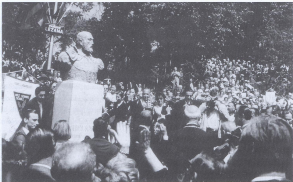
Einweihung des Schmidel-Denkmals von José Fioravanti in Buenos Aires, Parque Lezama, 1968. – Rechts im Vordergrund (mit Rücken zum Betrachter) Oberbürgermeister Hermann Stiefvater; auf dem Bild auch der damalige Außenminister Willy Brandt.