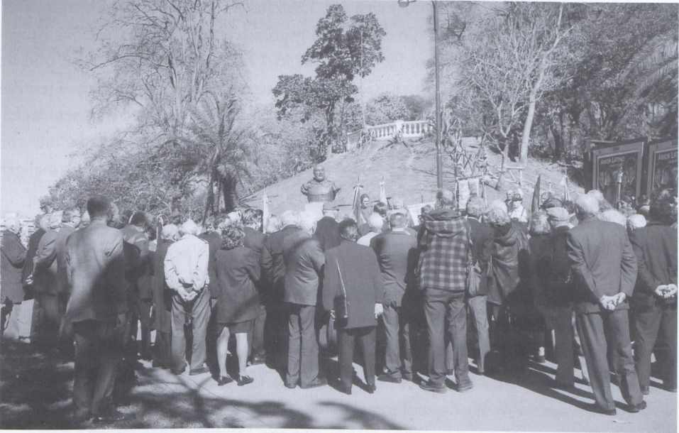
Foto von der Neueinweihung des Schmiedel-Denkmal 2000.