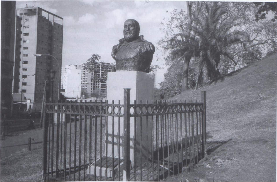
Der heutige Zustand des Schmiedel-Denkmal im Parque Lezama, Buenos Aires.