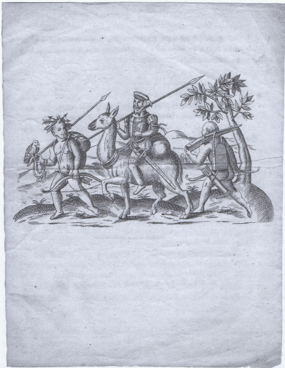
Das Schmidel-Bild der Bekanntmachung nach einer Illustration von Hulsius ist eine der frühesten Lithographien kurz nach der Erfindung dieser Drucktechnik.