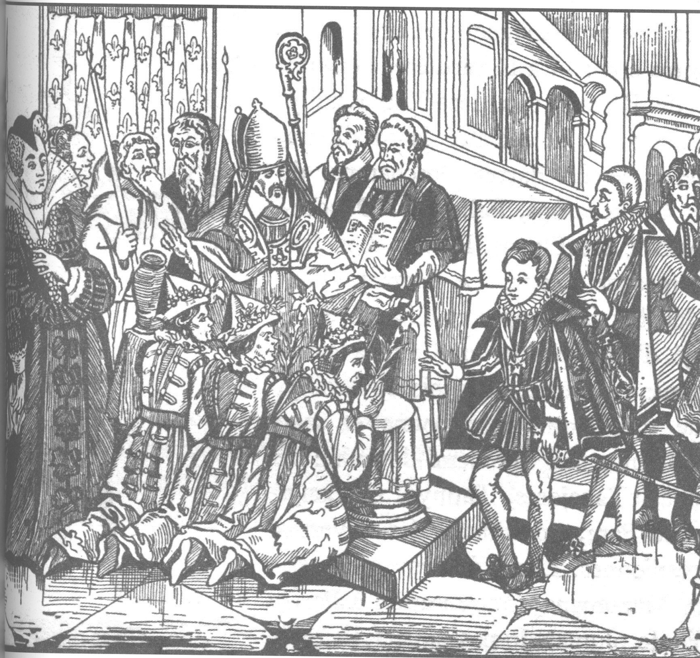
Le baptême de trois sauvages topinambas par l'évêque de Paris en présence du jeune roi Louis XIII (1613) d'après une gravure sur bois de l'époque