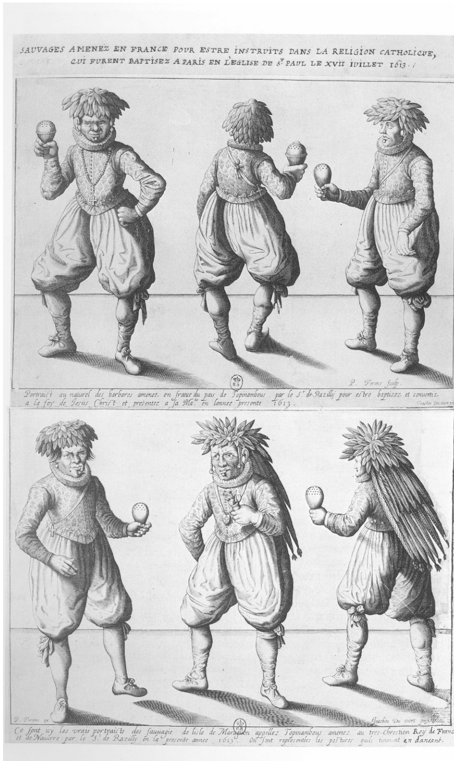
Abb. 6: Die zwei Einblattholzchnitte von Du Viert /Firens zu den tanzenden Indianern, Paris 1613.