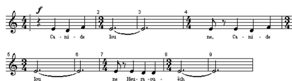
Figura 1. Melodia de Canide Ioune (LÉRY, 1585) no primeiro poema Canide Ioune – Sabbath , como seção A (c.1-8).

incorrer no exotismo completo aos padrões de forma composicional ocidentais como o equilíbrio entre a unidade e contraste dos temas que geram a grande forma dessa composição. De fato, o compositor utilizou as características diferenciais dos próprios cantos — diferentes entre si — para inserir o contraste na composição e reforçá-lo através do acompanhamento do piano (compasso 22).