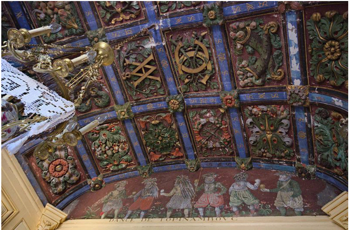
Abb.7: Tanz der Tupinamba, zeitgenössisches Fresko eines unbekanntenen Künstlers (nach Joachin Duviert) Château de Montbras (Meuse, Frankreich)