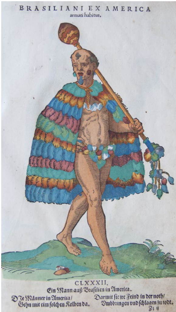
Abb. 5 Brasilianer. Aus: Habitus praecipuorum populorum (Nürnberg 1577)

haben, die ihrem Gehalt nach ikonographisch einen Standard in Bezug auf die fremden Länder setzte und als authentisch ernst genommen wurde.