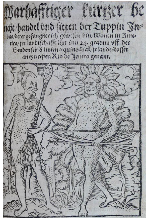
Abb. 4 Titelblatt des zweiten Buches

Das unvollständige Exemplar ohne Titelblatt ist original koloriert wie andere erhaltene Exemplare; das Exemplar der Biblioteca nazionale centrale di Roma weist bezeichnenderweise genau dieselbe Farbgebung auf wie das Exemplar in Halle, 51 was belegt, dass die Käufer damals bereits kolorierte Exemplare erwerben konnten, in die in großer Zahl hergestellt wurden. Die Darstellungen von Personen in Tracht, die seit dem Aufkommen des Genres in der Mitte des 16. Jahrhunderts in gedruckter Form – Vorläufer sind die Zeichnungen in thematisch geordneten privaten Skizzenbüchern von Künstlern – bekannt sind, enthielten von jeher eine Vielzahl von Indigenen mit typischer Kleidung und Attributen aus ihren jeweiligen Erdteilen. Sie beeinflussten in der zweiten Hälfte des Jahrhunderts auch die Illustrationen in den Reiseberichten stark. So ließen sich die unbekanntenen Künstler von Jean de Lérys Brasilienbuch, Histoire d'un voyage fait en la terre du Brésil von 1578, bei ihrer Darstellung der brasilianischen Indianer von einer Illustration im erwähnten Trachtenbuch inspirieren, auf der ein Indianerpaar mit Kind zu sehen ist. 52 Die Zeitgenossen verfügten demnach nicht nur über viele textliche, sondern auch über visuelle Bilder von der Neuen Welt, in die in vielen Fällen wie bei Staden durchaus authentische Angaben eingeflossen sind. Ein Vergleich von Stadens Frontispiz zum zweiten Buch (Abb. 4) mit der Abbildung eines