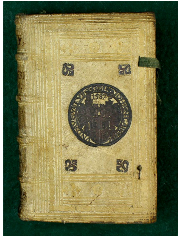
Abb. 3 Wappenstempel der Familie Lynar