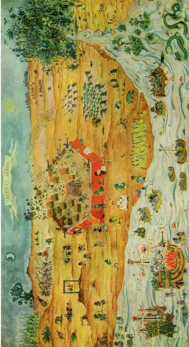
Das Ölgemälde von Oski zur Gründung von Buenos Aires, Grundlage für den Film von Fernando Birri von 1959. Inspiriert von der Abbildung von Buenos Aires in der Schmidl-Ausgabe von Levinus Hulsius, Nürnberg 1599.