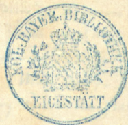
Titelblatt des Eichstätter Schmidl-Manuskripts (16. Jhdt.), Universitätsbibliothek Eichstätt

Zeit Groser gefar in kriegsleuten Inzuvorais vnd Inzuzogen: Wozu auß so von Dornrechen dar auß, bis auß das vire vnd fünfzigste. Da mir od 2 Decembria widre zu eant gesessen / gewant gab: us voren dem so mir schuch wirren vnd vnuwandren In der steden funderstuden vnd er drent auß Enzels firviren vossris von judo.