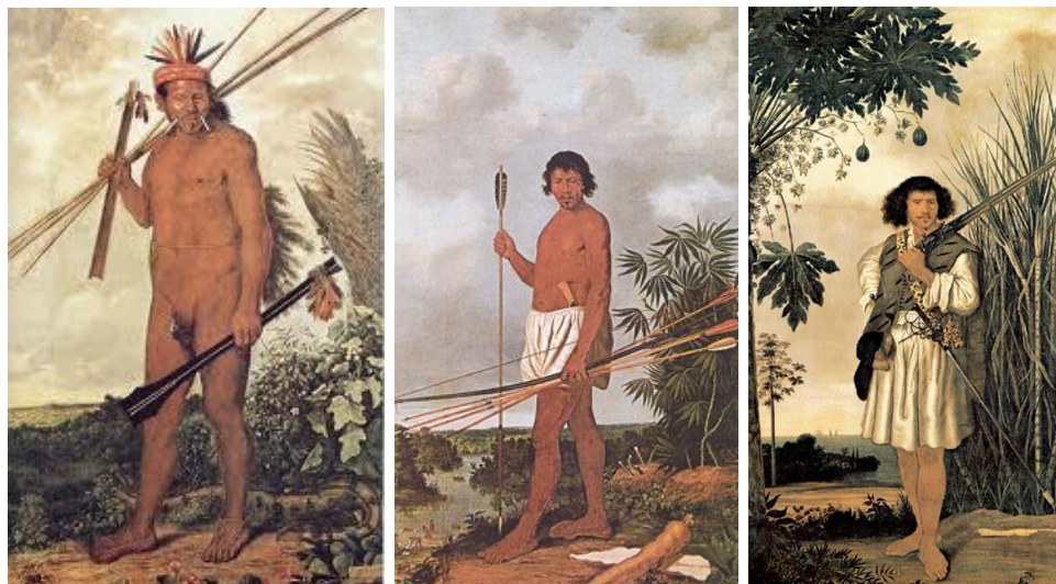
Abb. 2: Albert Eckhout, Indianerbilder Pernambuco (Recife) 1643. Heute: Ethnologische Abteilung des Nationalmuseums Kopenhagen ( http://eckhout.natmus.dk/gallery4.shtml )