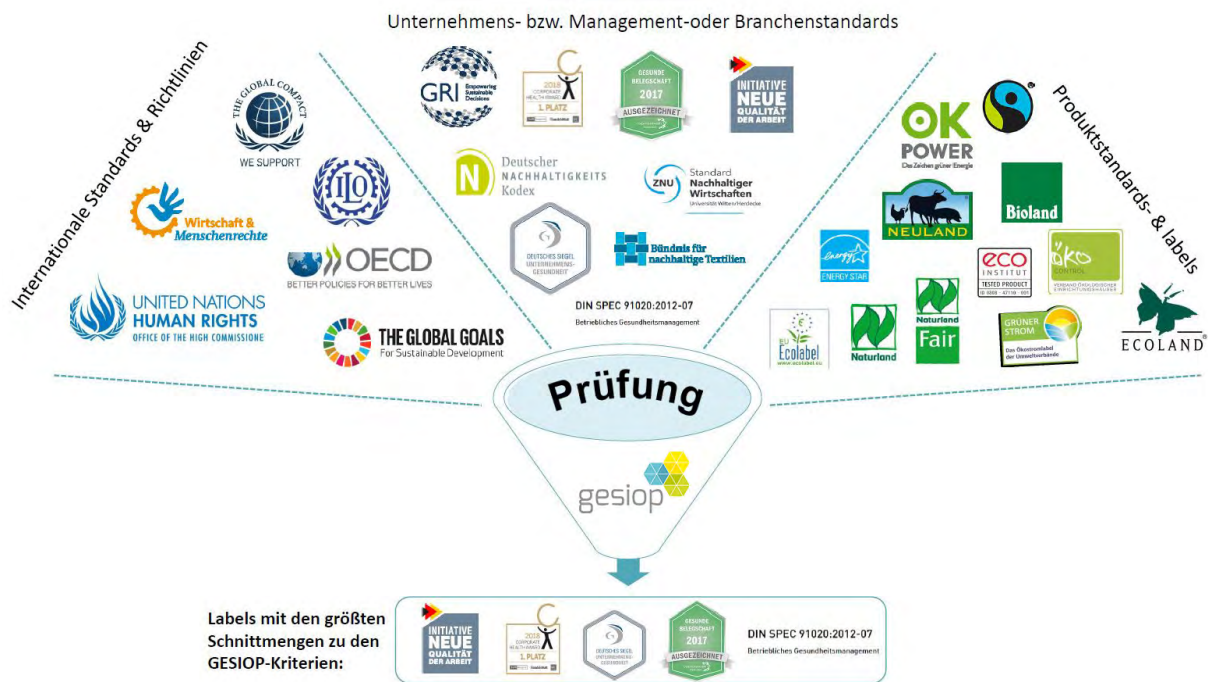
Grafik 1 Prüfung BGF Relevanz nach Label-Segmenten (eigene Darstellung)

Von allen drei Label-Segmenten sind die Siegel, Standards und Awards, die Unternehmen adressieren, am erfolgreichsten aus der Evaluation herausgegangen. Von den neun in diesem Bereich evaluierten Labels, konnten fünf als besonders vielversprechend bewertet werden: der INQA Check (4.2.9), der Corporate Health Award (4.2.4), das Deutsche Siegel Unternehmensgesundheit (4.2.3), die Initiative Gesunde Belegschaft (4.2.5) und die DIN SPEC 91020 (4.2.6).