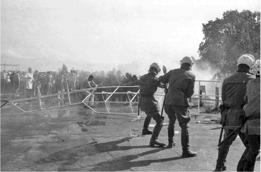
Abb. 1: Demonstration gegen neues Hochschulgesetz und Ordnungsrecht (9. 6. 1969).