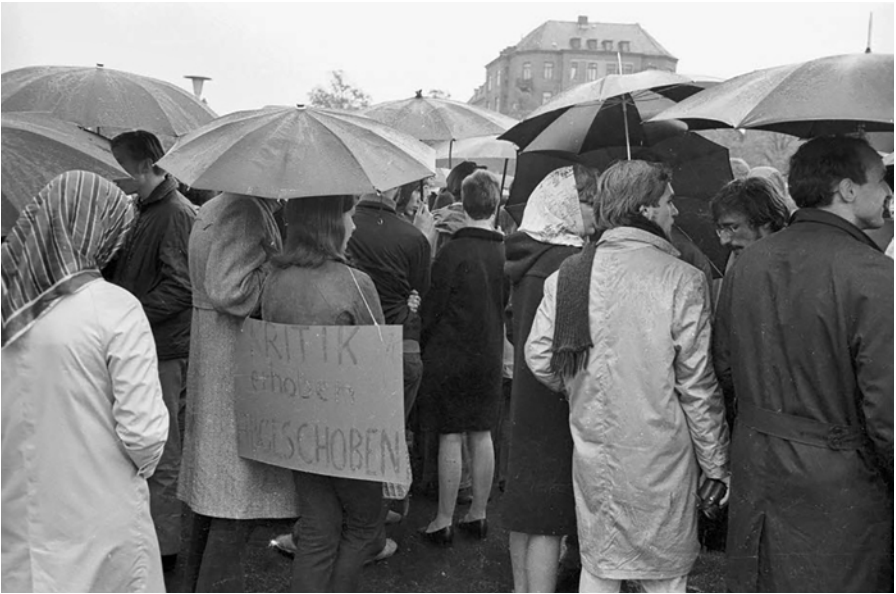
Abb. 6: Demonstration gegen den Verweis zweier Schüler von der Gelehrtenschule auf dem Exerzierplatz (9.10.1968).