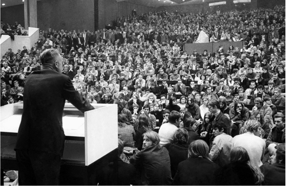
Abb. 2: Studentisches Teach-in im überfüllten Audimax der CAU (27.11.1969).