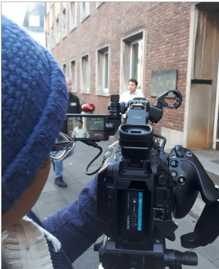
Abb. 3: Dreharbeiten in Köln vor dem Eingang zum Praetorium für das Lehrvideo Antike in der modernen Stadt , produziert von Stefan Feuser in Zusammenarbeit mit e.LK Medien – zentraler e-Learning Service der Christian-Albrechts-Universität zu Kiel (© 2018, Anna Lena Möller, alle Rechte vorbehalten).

An diese Einführung schlossen sich jeweils drei bis sechs Videos von bis zu zehn Minuten Länge an, die von Expert*innen aus fünf verschiedenen Ländern produziert wurden. Die Videos sind entweder vor Ort in archäologischen Stätten oder in modernen Städten gedreht worden (Abb. 3), je nach dem Thema des Videos, den Lernzielen sowie den allgemeinen finanziellen und administrativen Möglichkeiten und Einschränkungen.