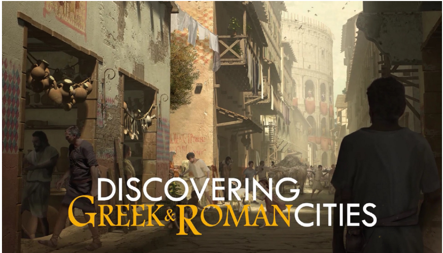
Abb. 1: Titelseite des MOOC Discovering Greek & Roman Cities (© 2019, Zeichnung: Jonathan Westin, Design: Florent Atlas).

Die Partner entwickelten digitale Lernmaterialien für den Einsatz an Universitäten und haben den frei zugänglichen Massive Open Online Course (MOOC) Discovering Greek & Roman Cities für ein breites Publikum erstellt. (Abb. 1)