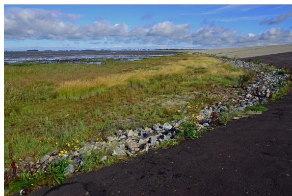
Abb. 2: Seedeich nördlich des Eidersperrwerks im Bereich des Vorkommens von Colletes halophilus mit angrenzender Steinschüttung und Salzwiese.

In den Jahren 2015 (22. August) und 2016 (23. August) wurden bereits an dem beschriebenen Abschnitt des Seedeichs Weibchen von C. halophilus an A. tripolium gesichtet. Außerdem wurden 2016 Weibchen beobachtet,