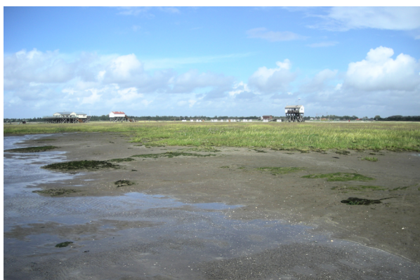
Abb. 3: Salzwiese mit Vorkommen von Colletes halophilus bei St. Peter-Ording vor dem Ortsteil Dorf mit angrenzender Wattfläche. Auf der Höhe des rechten Pfahlbaus befindet sich der Sandstrand.

Am 23.8.2017 sammelten hier schätzungsweise 30 Individuen von C. halophilus Pollen und Nektar an Strandastern. Es konnten keine Nester auffindig gemacht werden. Zwei Weibchen wurden als Belegexemplare entnommen (E08°37'25" N54°17'54", leg. M. Povel, det. M. Kuhlmann).