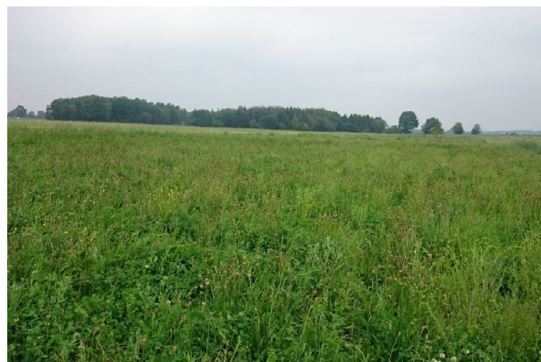
Abb. 2: Fundort von Anisodactylus signatus (Panzer, 1797) nördlich von Neumünster zum Zeitpunkt der ersten Leerung der Bodenfallen am 30.05.2017.