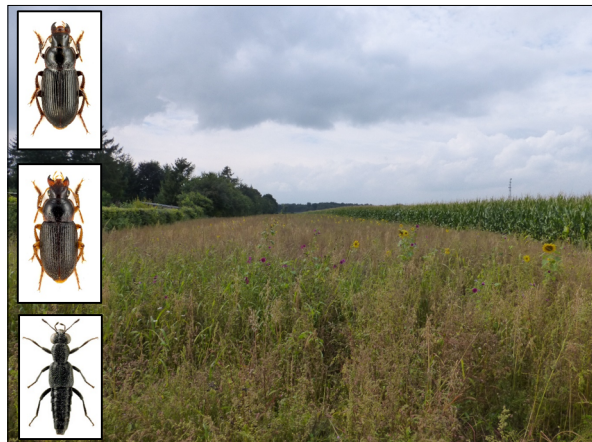
Abb. 1: Die Blühfläche im Norden von Neumünster am Roschdohler Weg auf stark humosem Sandboden (org. Substanz: 8,1-15 %) war Fundort von seltenen Arten wie Harpalus calceatus (oben,), H. griseus (Mitte,), Thanatophilus dispar und Stenus atratulus (unten,). Foto der Blühfläche: 22.8.2016.