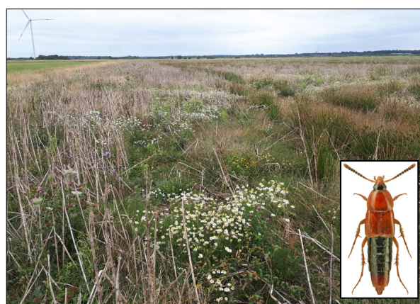
Abb. 4: Die Blühfläche bei Süderlügum an der deutsch-dänischen Grenze auf stark humosem, tonigem Lehm (org. Substanz: 8,1-15%) war Fundort von Bolitobius castaneus boreomontanicus und Gabrius austriacus. Foto der Blühfläche: 23.7.2018.