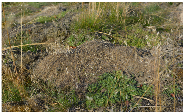
Abb. 5: Nestkuppe von Nest 2. Der Nesthügel ist etwas länglich gebogen und weist vier kleinere Erhebungen auf, unter denen sich Nestkammern befinden. Im Vordergrund ist der Bewuchs von Galium saxatile und Deschampsia flexuosa zu erkennen. 7.8.2020, 8:29 Uhr MEZ.