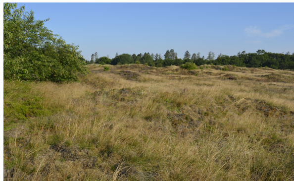
Abb. 4: Biotop des Nestes 2 von Formica pressilabris . Das Nest liegt in der Mitte des Bildes auf der Kuppe eines Dünenzuges, der hauptsächlich von Deschampsia flexuosa bewachsen ist. Am linken Bildrand ist ein Gebüsch von Prunus serotina sowie eine Empetrum nigrum -Fläche zu sehen. Foto: U. Sörensen, 7.8.2020, 8:30 Uhr MEZ.

Als Nahrung werden die Ausscheidungen von Wurzelläusen an den Wurzeln der Gräser und auch an oberirdischen Pflanzenorganen aufgenommen. Daneben werden auch in geringerem Maße Kleintiere erbeutet oder Aas als Nahrung angenommen.