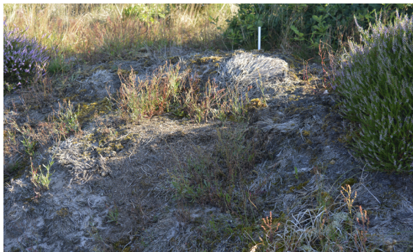
Abb. 3: Die Oberfläche von Nest 1. Das Nest liegt an einem Sandhang und ist nach Südwesten exponiert. Die Kuppe ist sehr flach, besteht hauptsächlich aus zerbissenen Halmen von Deschampsia flexuosa . Umgeben wird die Nestkuppe von Rumex acetosella -Pflanzen. Zum Zeitpunkt der Aufnahme liegt sie noch im Halbschatten des östlich angrenzenden Calluna vulgaris -Bewuchses. Foto: U. Sörensen, 7.8.2020, 8:17 Uhr MEZ.