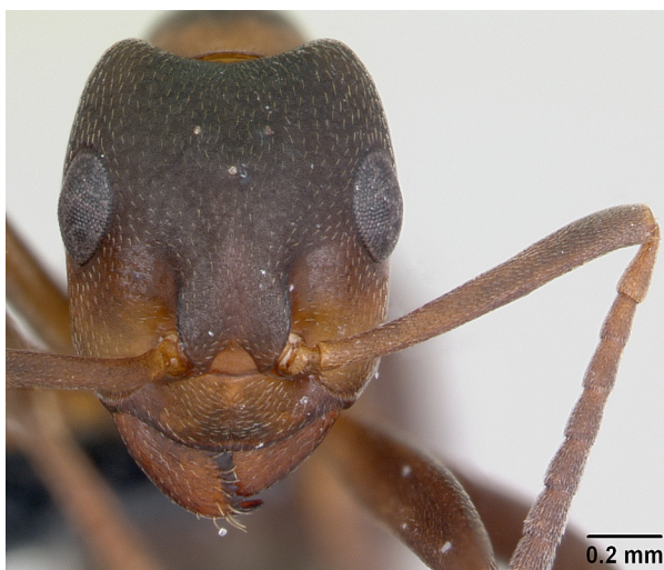
Abb. 7: Kopf von Formica pressilabris in Frontalansicht. Die entscheidenden Merkmale zur Artdiagnose sind das Fehlen der abstehenden Behaarung auf den Augen sowie die große Distanz zwischen den Pubeszhaaren insbesondere im Ocellen-Dreieck.