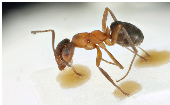
Abb. 6: Arbeiterin von Formica pressilabris in Seitenansicht. Deutlich erkennbar ist die Einkerbung am Hinterhauptsrand sowie die fast völlig fehlende abstehende Behaarung auf der Körperoberfläche. Sie findet sich erst ab dem 3. Gastertergit.