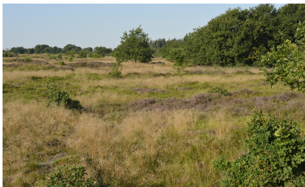
Abb. 1: Biotop des Nestes 1 von Formica pressilabris am Rande eines Eichengehölzes. Die Fläche besteht aus einem kleinräumigen Muster von Beständen der Besenheide ( Calluna vulgaris ), Krähenbeere ( Empetrum nigrum ) und Geschlängelter Schmiehe ( Deschampsia flexuosa ). Es ist auch junger Aufwuchs der Stieleiche ( Quercus robur ) und der Sandbirke ( Betula verrucosa ) erkennbar. Foto: U. Sörensen, 7.8.2020.