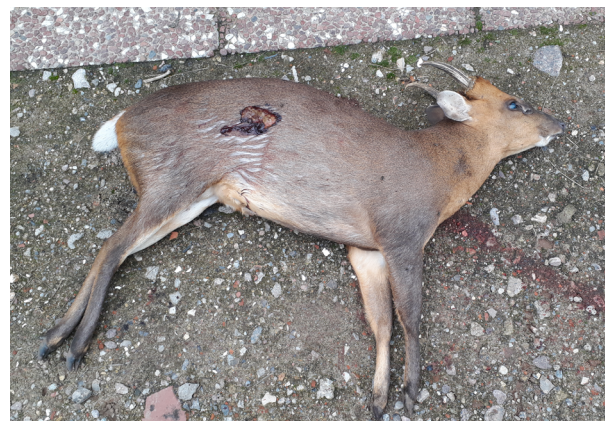
Abb. 2: Links oben: ein bei Kosel (RD) im Schafnetz verendetes Muntjak (26.3.2020); rechts oben: mit Baustahlmatten geschützte Futtereimer sind für Muntjaks leicht nutzbar (1.2.2021, in legaler Gehegehaltung); links mittig: ortsnahe Aufenthaltsorte von entlaufenen Muntjaks scheinen sich besonders für den Fang mit Hilfe von Zaunanlagen zu eignen (Kosel, 24.5.2020); rechts mittig: eines der noch freilaufenden Tiere (mit entfernten Ohren? Kosel, 25.6.2020); links unten: das bei Schülpe (RD) aus dem NOK tot geborgene (säugende) Tier (28.9.2020); rechts unten: ein bei Kummerfeld (SE) erlegtes Muntjak (30.9.2020).

nicht ersetzen (siehe entsprechende Forumdiskussion auf WildundHund.de 2018). Solche Regelungen können vom Gesetzgeber schnell nachgeholt werden, wie die Aufnahme der Neozoen Marderhund, Waschbär, Mink und Nutria in das Jagdgesetz als jagdbare