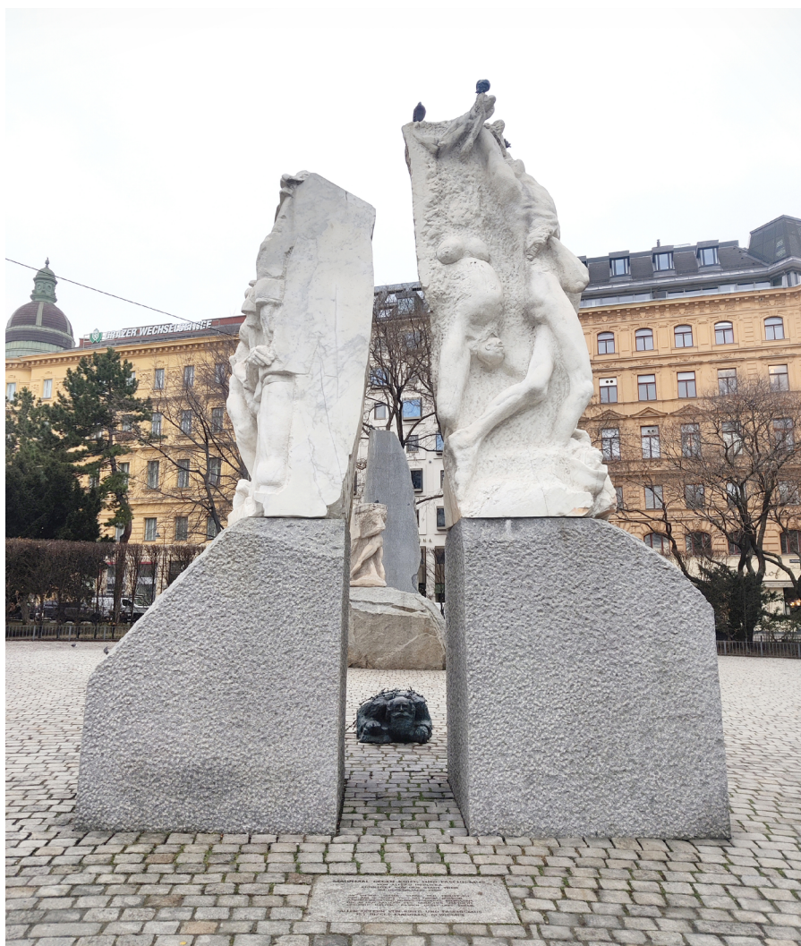
Abb. 2: Mahnmal gegen Krieg und Faschismus, Alfred Hrdlicka (1988), Gesamtansicht, Foto: Thomas Hellmuth. An der Stirnseite des Mahnmals befindet sich das »Tor der Gewalt«, das an die Opfer des Nationalsozialismus erinnert. Dabei wird – oft wegen der Vermischung kritisiert – sowohl den Opfern in den Vernichtungslagern und Gefängnissen als auch an die gefallenen Soldaten (rechter Block) gedacht. Hinter dem »straßenwaschenden Juden« (siehe Abb. 3) befindet sich die Skulptur Orpheus betritt den Hades. Diese ist den ermordeten Widerstandskämpfer*innen und jenen gewidmet, die durch den Bombenangriff auf den Philipphof ums Leben kamen. Auf dem Areal des Philipphofs wurde das Mahnmal errichtet. Dahinter befindet sich schließlich der Stein der Republik, in den Auszüge der österreichischen Unabhängigkeitserklärung von 1945 eingraviert sind und der an die Wiederauferstehung der Republik Österreich erinnern soll.