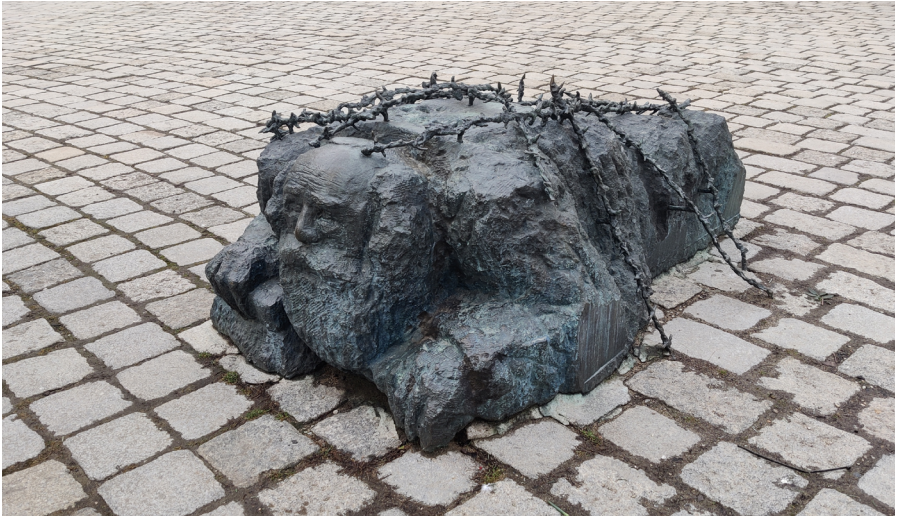
Abb. 3: Figur des ›straßenwaschenden Juden‹, Alfred Hrdlicka (1988), Detail des Mahnmals gegen Krieg und Faschismus. Der ›straßenwaschende Jude‹ steht für die Erniedrigung und Verfolgung der österreichischen Jüdinnen und Juden. Kritisiert wurde daran, dass damit die Demütigung fortgesetzt würde.