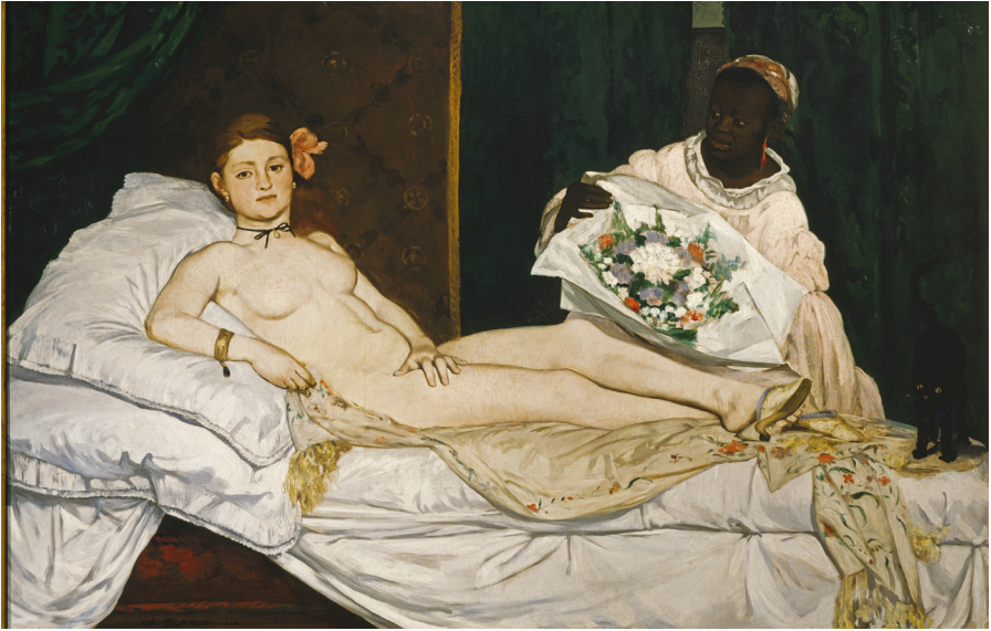
Abb. 6: Olympia, Édouard Manet (1863), Öl auf Leinwand, Paris, Musée d'Orsay.

sche Staatsbürgerschaft annahm, schloss sich im Zweiten Weltkrieg der französischen Resistance an und engagierte sich gegen Rassismus, unterstützte dabei die US-amerikanische Bürgerrechtsbewegung und gründete eine ›Regenbogenfamilie‹, indem sie zwölf Waisenkinder aus unterschiedlichen Ländern adoptierte. 63 Erst kürzlich wurde sie – im Übrigen als erste schwarze Frau – von der Französischen Republik für ihren Einsatz gegen Rassismus und Demokratie durch die Überführung ihrer sterblichen Überreste in den Panthéon, die nationale Ruhmeshalle Frankreichs, geehrt.