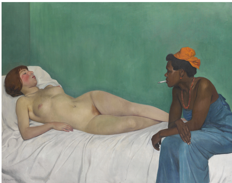
Abb. 5: La Blanche et la Noire, Félix Vallotton (1913), Sammlung Hahnloser-Jaeggli Stiftung, Winterthur

und unter anderem auch die Dominanz ›weißer‹ Kunst kritisieren, 62 die Aufmerksamkeit auf die afroamerikanische Künstlerin und politischen Aktivistin Faith Ringgold lenken. Diese spielt wie Vallotton mit ihrem Siebdruck Jo Baker's Birthday (1993) auf Manets Olympia an, indem sie das Motiv allerdings völlig umkehrt. Eine halbnackte schwarze Frau, Josephine Baker, liegt nun lachend auf einem Bett, während im Hintergrund eine weiße Dienerin mit dem Decken eines Esstisches beschäftigt ist (Abb. 7). Freilich steht Josephine Baker nicht zufällig im Mittelpunkt des Kunstwerkes. Als Tänzerin in Revuen hatte sie in den USA erste Erfolge und wurde seit 1925 in Paris mit dem Solostück Mädchen mit dem Bananenröckchen berühmt. In diesem Solostück, in dem sie halbnackt tanzte, finden sich weniger sexuelle Anspielungen als vielmehr Versuche, Sexismus und rassistische Vorurteile mit Hilfe von Humor zu entlarven. Baker, die 1931 die französi-