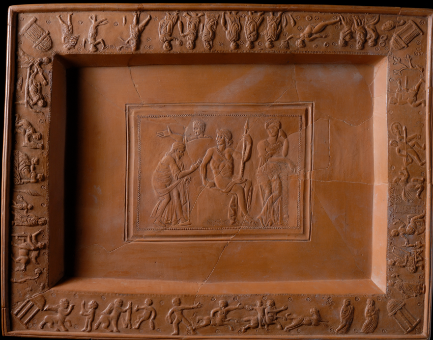
Abb. 3: Rekonstruktion eines spätantiken nordafrikanischen Tontabletts mit Achillzyklus. Quelle: Archäologische Staatssammlung München, Inv. 1976, 2260 a.

zeigen die Kindheit und Jugend des Achill, beginnend mit seiner Geburt und endend mit der Entdeckung des abgehenden Helden auf Skyros, die die Voraussetzung für dessen Teilnahme am Trojanischen Krieg darstellt.