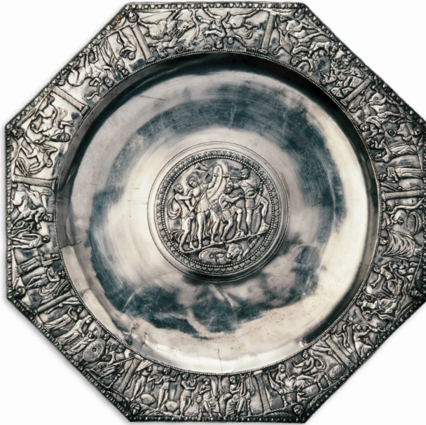
Abb. 1: Achillesplatte aus dem Silberschatz von Kaiseraugst.