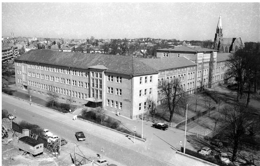
Abb. 1: Medizinische Klinik der Universitätsklinik (UKSH) in der Schittenhelmstraße 12. © 1965 Friedrich Magnussen, veröffentlicht unter der Lizenz CC-BY-SA 3.0 DE , Stadtarchiv Kiel , Sig. 34.808.

Einschätzung über Alfred Schittenhelm stimme. 38 Im Mai 2016 berichteten die KN über die anstehende Senatssitzung der Universität Kiel, in der über den Entzug der Ehrensenatorenwürde beratschlagt werden sollte und verwiesen auf eine mögliche Folgeentscheidung bezüglich der Umbenennung der Schittenhelmstraße. 39