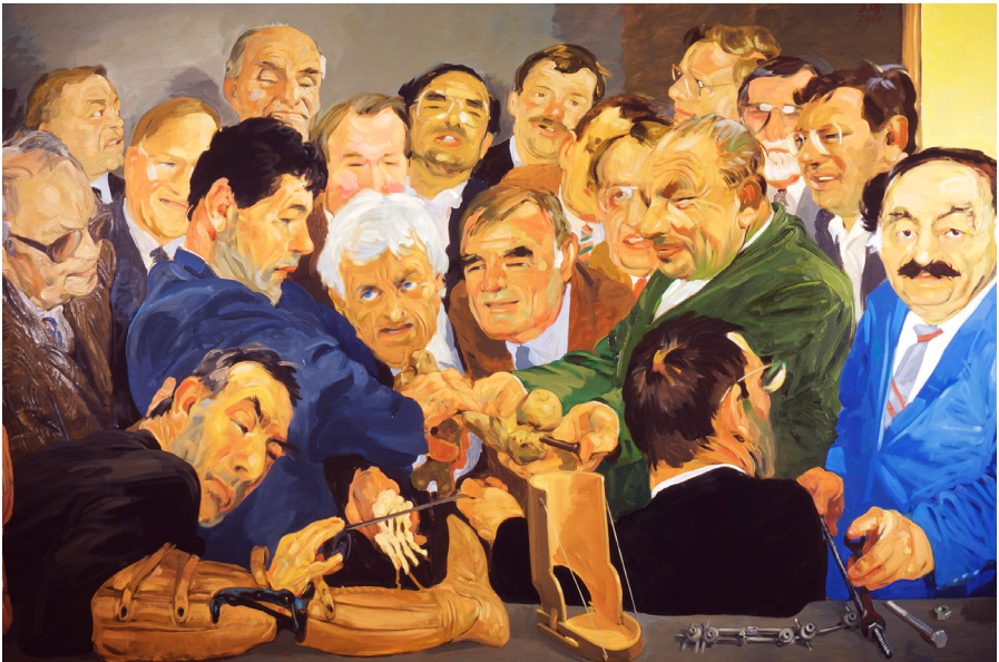
Abb. 2: Ausschnitt aus dem Wandbild Aus der Geschichte der Unfallchirurgie im Hörsaal des Berufsgenossenschaftlichen Unfallkrankenhauses Hamburg. Unter den dargestellten Unfallchirurgen ist Gerhard Küntscher (im grünen Jacket). © 1995 Johannes Grützke, veröffentlicht unter der Lizenz CC-BY-SA 3.0 DE , Wikimedia Commons .

aufgrund neuer Erkenntnisse über Küntschers NS-Vergangenheit. Benannt wurde die Straße nach Küntscher, da dieser für die Erfindung des Marknagels geehrt werden sollte. 54 Ratschko und Susanne Mehs veröffentlichten im Mai 2011 im Schleswig-Holsteinischen Ärzteblatt einen Aufsatz über Gerhard Küntschers Nähe zum Nationalsozialismus. 55 Nach der Offenlegung von Küntschers nationalsozialistischer Vergangenheit bestand für die Stadt Flensburg die Notwendigkeit, sich von diesem ehemaligen Nationalsozialisten zu distanzieren. Im Gegensatz zu der Auseinandersetzung um Catel gaben diesmal nicht die Medien den Ausgangspunkt für eine erinnerungskulturelle Debatte. Die Schleswiger Nachrichten hoben vielmehr noch 2010 Küntschers wissenschaftliche Leistungen in einem Artikel hervor, ohne einen Kommentar über dessen NS-Vergangenheit. Es fehlte scheinbar noch an der nötigen Sensibilität, die eine vorzeitige Aufarbeitung seiner NS-Vergangenheit bewirkt hätte. 56