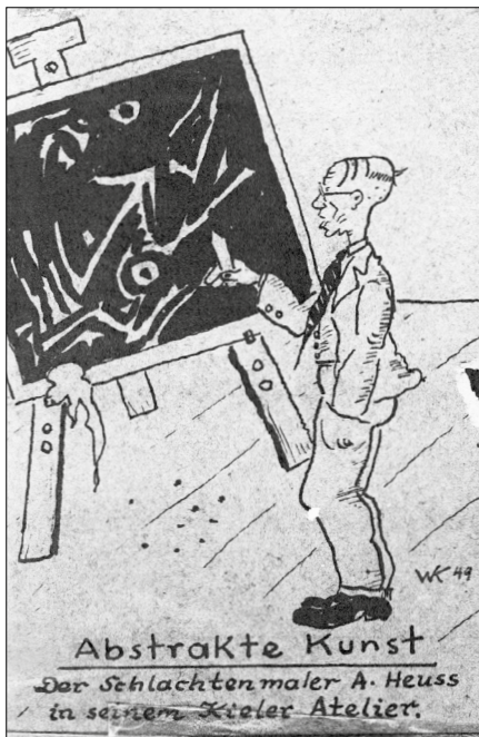
Abb.1: Karikatur von Alfred Heuß, Werner Klose, Landesarchiv Schleswig-Holstein (LASH), alle Rechte vorbehalten.