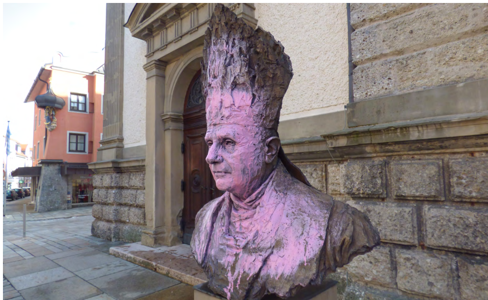
Abb. 1: Traunstein, Pfarrkirche St. Oswald: Büste Papst Benedikts XVI. von Johann Brunner nach Farbanschlag, 6. März 2016.

Als die Gemeindeglieder der katholischen Stadtpfarrkirche St. Oswald im oberbayerischen Traunstein am 6. März 2016 zum Sonntagsgottesdienst zusammenkamen, mussten sie feststellen, dass in der Nacht wieder einmal die Bronzestatue Papst Benedikts XVI. von Unbekannten beschmiert worden war (Abb. 1). Diesmal war der Angriff mit rosa Sprühfarbe erfolgt, am Montag darauf berichtete artig die Lokalpresse, die Polizei appellierte in Ermangelung eines politischen Bekennterschreibens an Hinweise aus der Bevölkerung 1 – doch unabhängig davon, wer denn nun die Tat wirklich begangen hatte, fiel der Verdacht meines Wissens nicht sogleich (wie es Jahrzehnte zuvor noch ganz normal gewesen wäre) auf die Evangelisch-Lutherischen in Bayern, die ja immerhin das protestantische Violett in etlichen Schattierungen im Corporate Design führen. Was also früher ganz nahegelegen hätte, nämlich die Sabotage am