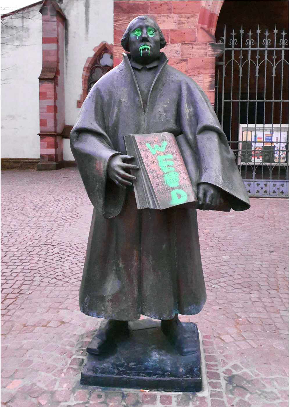
Abb. 2: Landau, evangelische Stiftskirche: Lutherdenkmal von Martin Mayer nach Farbanschlag, 14. Januar 2020.