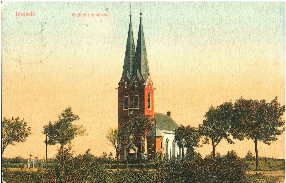
Abb. 8: Idstedt, Gedächtniskirche. Ansichtskarte vor 1910. Gemeinfrei. Quelle: Sammlung Tim Lorentzen, Kiel.

Geschichte. Heute können im dortigen Museum Dänen und Deutsche zweisprachig lernen, dass dieser Bürgerkrieg mit Tausenden von Toten und Verletzten völlig sinnlos war. 23 Eine solche Vergeblichkeit hätte man damals kaum ertragen können, darum musste die Niederlage bei Idstedt von deutscher Seite zu einer notwendigen Etappe zwischen ›Schleswig-Holsteinscher Erhebung‹ und dem endgültigen Sieg über Dänemark stilisiert werden, nur so erhielt das Sterben nachträglich einen Sinn.