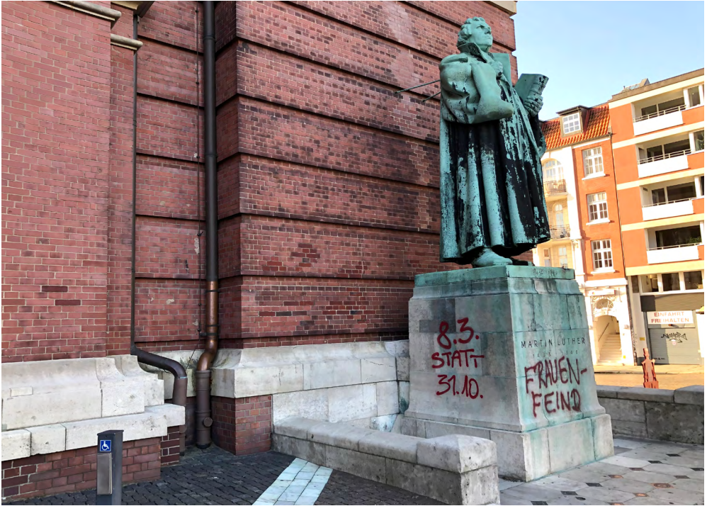
Abb. 3: Hamburg, Hauptkirche St. Michaelis: Lutherdenkmal von Otto Lessing nach Farbanschlag, 3. November 2020.

bayerisch-katholischen Selbstbewusstsein reflexartig dem Konfessionsgegner in die Schuhe zu schieben, käme heute nicht mehr in Betracht, auch nicht im papsttreuen Oberbayern.