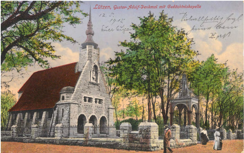
Abb. 7: Lützen, Gustav-Adolf-Denkmal mit Gedächtniskirche; Ansichtskarte von E. Hartwig, Lützen, gelaufen 1915. Gemeinfrei. Quelle: Zeno.org .

Glauben, wie er gethan«, 19 sollte das Denkmal ausdrücklich kein direkt militärisches Schlachtendenkmal sein, sondern der gesamten protestantischen Christenheit gehören. Ein weiterer Sakralisierungsschritt wurde 1907 mit der Einweihung der schwedischen Gustav-Adolf-Kapelle getan. Staat und Staatskirche beider Monarchien, Schwedens und Sachsens, gedachten ihres »germanischen« 20 Helden und betonten die gemeinsame lutherische Nachfolge. 21 Das Ensemble dokumentiert mithin die stufenweise Sanktifizierung des evangelischen Schwedenkönigs im Kontext einer politisch-protestantischen Konfessionsfrömmigkeit (Abb. 7).