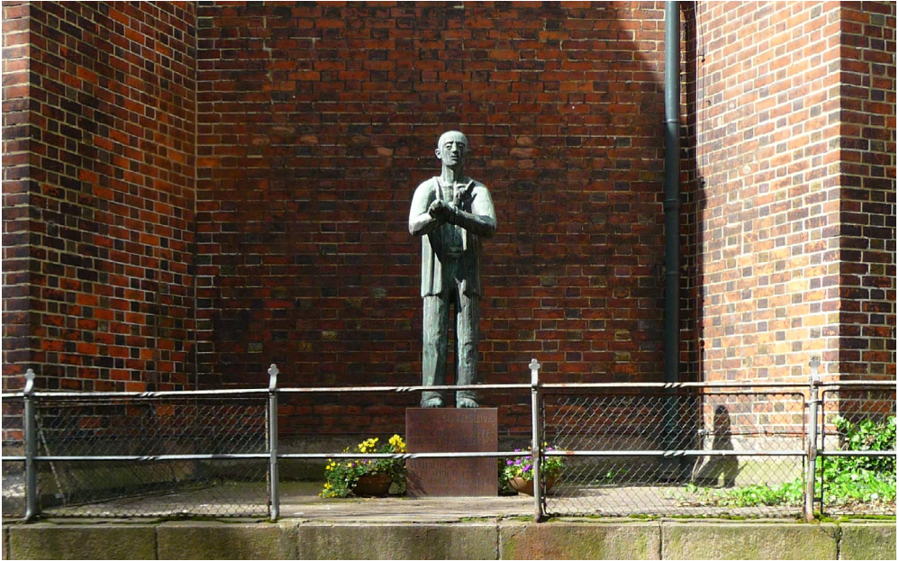
Abb. 9: Hamburg, Hauptkirche St. Petri: Bonhoeffer-Denkmal von Fritz Fleer. Bronze, 1977–1979.

Anwältin jedes Widerstands gegen Hitler. Auch die Idee einer monumentalen Märtyrerkirche, Maria Regina Martyrum , wurde einige Zeit später tatsächlich realisiert und gehört in denselben Zusammenhang. 29