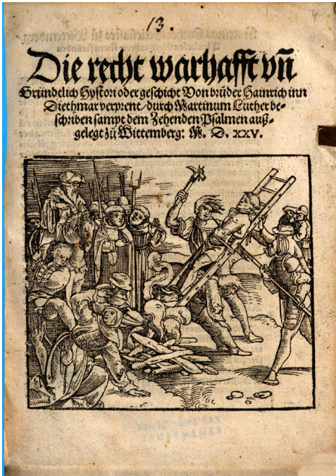
Abb. 4: Die Hinrichtung Heinrichs von Zütphen auf dem Titelholzschnitt zu Martin Luther: Die recht warhafft vn[d] Gründtlich Hystori oder geschicht Von bruder Hainrich inn Diethmar verprent, 1527 (VD16 L 7094). Veröffentlicht unter der Lizenz NoC-NC 1.0 . Quelle: Staatliche Bibliothek Regensburg, Sig. 999/4Theol.system.758(143, https://mdz-nbn-resolving.de/details:bsb11071971 ).

Sprung voraus, dass die verurteilende Kirche nicht Kirche ist! Hus hat eine juristische Appellation an Jesus Christus gerichtet, um zu demonstrieren, dass die sichtbare Kirche ihre Autorität verspielt hätte und die Böhmen nur Christus als ihren Herrn anerkennen würden. 9