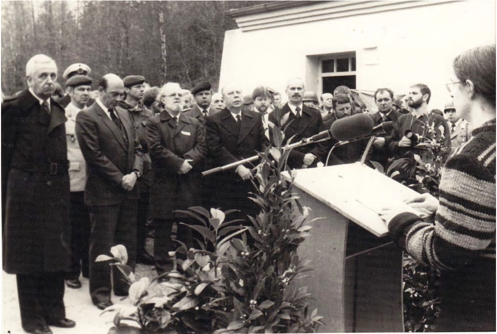
Abb. 10: Flossenbürg, KZ-Gedenkstätte: Gedenkakt am 9. April 1985 mit Manfred Wörner (2. v. l.), Thomas Werner (am Pult) und emporgehaltenen Kirchentagstüchern.