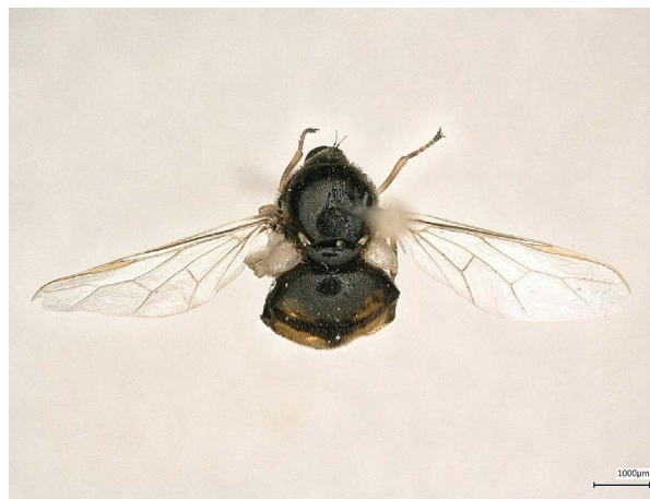
Abb. 3: Acrocera orbiculus, ♀, 30.6.2022, Süderlügumer Binnendünen, Dorsalansicht (30x): Auffallend ist die verhältnismäßig große Spannweite von ca. 11 mm. Nahe der Flügelspitze befindet sich ein länglicher Verschmelzungsbereich von Costa und Radialader R 1. Darunter gabeln sich die Radialadern R 4+5. Die Adern R 2+3 fehlen.

(zusammen 366 µm lang). Die Mundwerkzeuge sind unsichtbar unter dem Kopf verborgen.