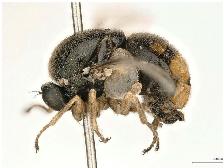
Abb. 1: Acrocera orbiculus, ♀, 30.6.2022, Süderlügumer Binnendünen, Lateralansicht (60x): Der kleine Kopf, mit den länglichen Fühlern oberhalb der Facetten, verbirgt sich halb unter dem großen Thorax. Die große Thorakalschuppe bedeckt die etwas durchscheinende Haltere.

Hessen enthalten. Für A. orbiculus dokumentiert er eigene Funde von 15 Exemplaren aus 5 Lokalitäten Sachsens aus dem Jahre 2002. Ein weiteres genanntes Exemplar stammt aus dem Jahre 1906 ebenfalls aus Sachsen.