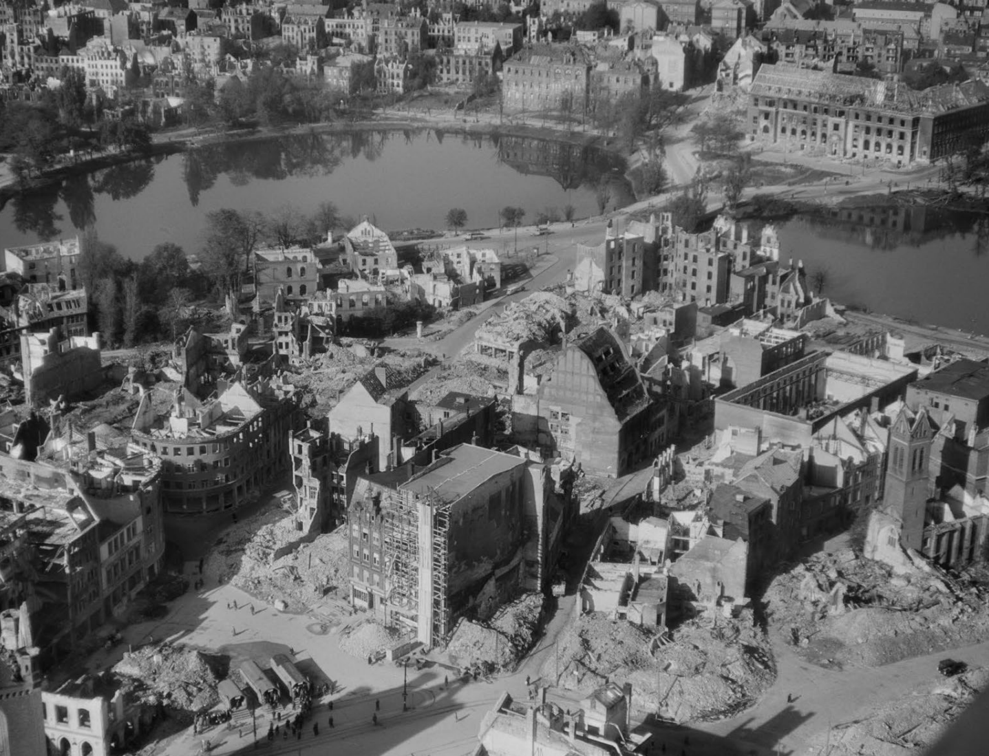
↑ Abb. 4. Die zerstörte Kieler Altstadt im September 1944, am rechten Bildrand die Ruinen des Klosters. Fotograf unbekannt, veröffentlicht unter der Lizenz CC BY-SA-3.0 DE . Stadtarchiv Kiel, Fotoarchiv , Sign. 36.313.

den 1950er Jahren durch Propst Hans Asmussen vor dem Abbruch gerettet wurde. 23 Der ursprüngliche Gedanke der Stadtplaner, die ganze Halbinsel einzuebnen und vollständig neu zu bebauen, setzte sich nicht durch, auch weil durch den Neubau unseres Wohnheims die bescheidenen Reste des alten Klosters für die Nachwelt erhalten blieben: Nur die gotischen Gewölbe von Refektorium und Kreuzgang hatten standgehalten, die Grabplatte des Stifters wurde zerbrochen aus den Trümmern der völlig zerstörten Klosterkirche geborgen. Im Mai 1949, zwei Wochen vor dem Grundgesetz, feierte man am Klosterkirchhof Richtfest und