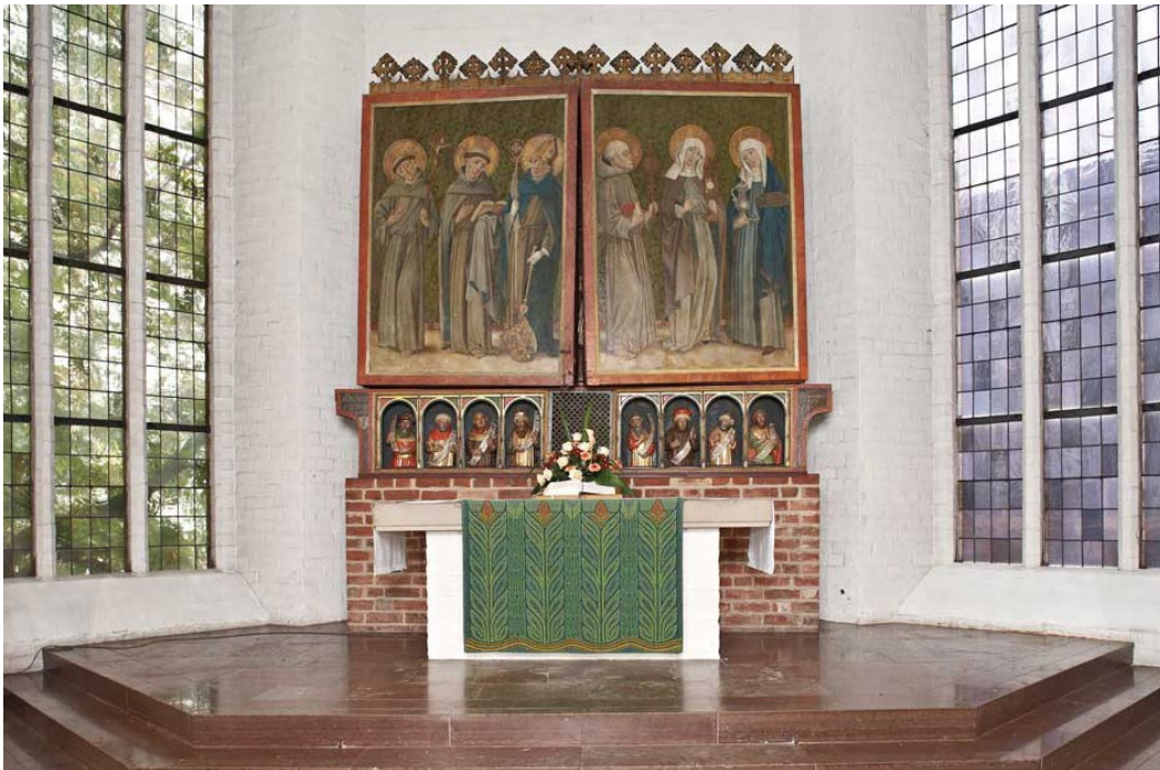
↑ Abb. 1. Kiel, Citykirche St. Nikolai: Altar aus der Franziskanerkirche (um 1460), Foto: Alexander Voss, Kiel.

keiner Milchkanne, wie die Legende sagt. 4 Erhalten blieb aber der heute in der Nikolaikirche stehende gotische Flügelaltar der Franziskanerkirche, ein überhaupt nicht armseliges Kunstwerk mit herrlicher Tafelmalerie, Schnitzwerk und Blattgold, das aber heute ganz dringend einer fachgerechten Rettungsaktion bedarf, damit es nicht in den nächsten Jahren buchstäblich in sich zusammenklappt. So ist der reichste Kunstschatz, der uns in Kiel als direkter Zeuge der franziskanischen Zeit geblieben ist, nun doch wieder auf Almosen angewiesen. 5