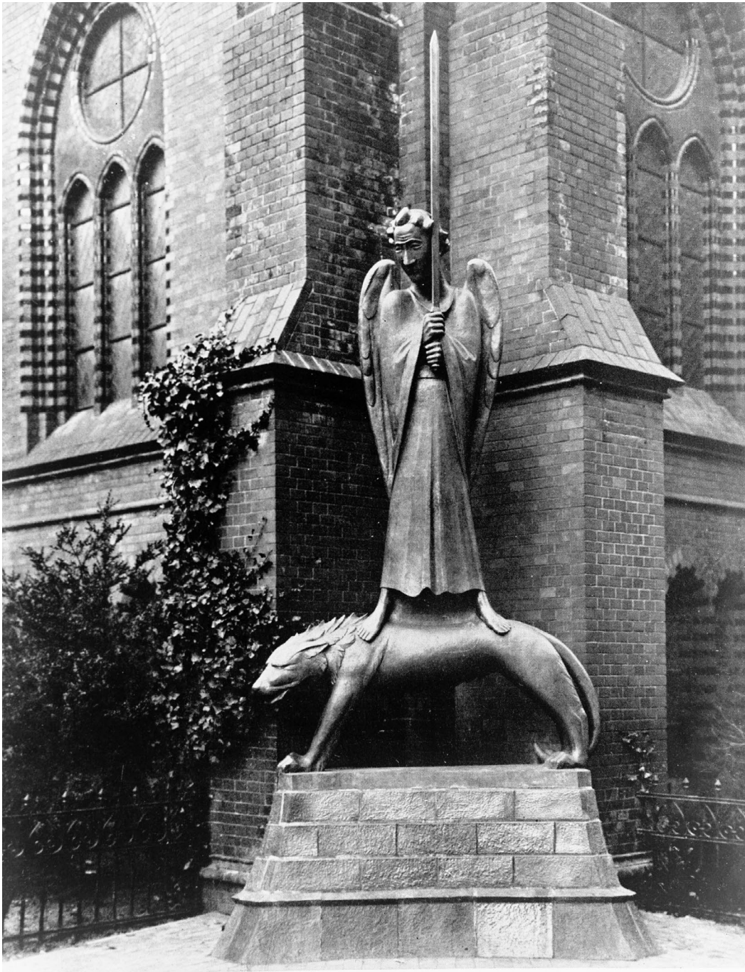
↑ Abb. 3. Ernst Barlachs Geistkämpfer war 1928 für den Standort an der Heiligengeistkirche geschaffen worden. Aufnahme um 1930.