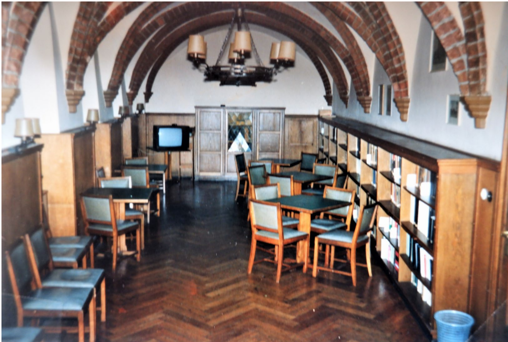
↑ Abb. 6. Das Refektorium des ›Kieler Klosters‹ als Bibliothek und Aufenthaltsraum. Aufnahme kurz vor der Abgabe der Räume für Repräsentationszwecke 1991.

jedoch zunehmend hinterfragt wurde. Einer der Pastoren forderte deshalb, ihm diesen Einfluss auf die Studierenden endlich zu entwinden, um anschließend die Verwaltung des Klosters und des Hauses Düsternbrook zusammen mit dem noch unabhängigen Dietrich-Bonhoeffer-Haus am Schrevenpark gemeinsam neu zu regeln. Und wirklich: Im März 1969 trat Redeker in den Ruhestand, im Mai 1970 starb er, gleich darauf wurde der Verein umstrukturiert und nahm tatsächlich das Dietrich-Bonhoeffer-Haus als dritten Standort mit unter seine Obhut. 30