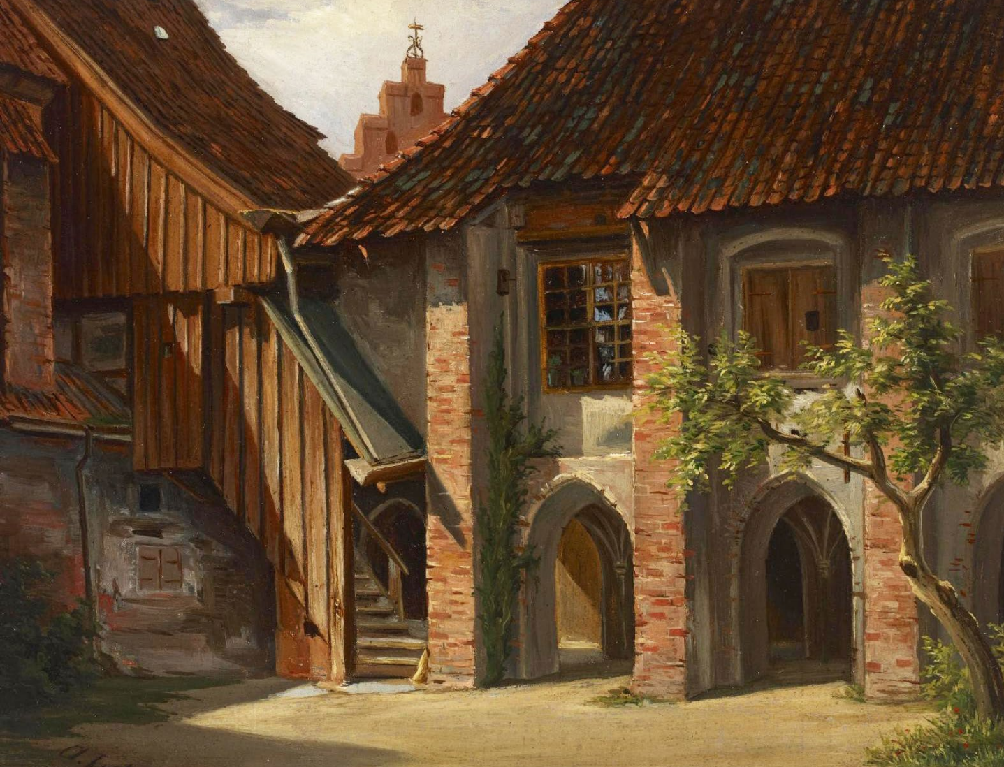
↑ Abb. 2. Kreuzgang der Heiligengeistkirche. Ölgemälde von Adolf Lohse (1907). Schleswig-Holsteinische Landesbibliothek – Landesgeschichtliche Sammlung, Inv.-Nr. 1906-1.

sturzgefährdet, auch das Theologicum nurmehr eine Ruine, die 1747 wieder abgerissen wurde, und um die Bücher der Universitätsbibliothek vor Regenwasser zu schützen, hatte man sie in einem angemieteten Privathaus zwischenlagern müssen. 15 Von anfänglich 140 Erstsemestern, zur Hälfte Theologiestudenten, waren nach einem Jahrhundert ganze 14 Neueinschreibungen geblieben. Nur die Initiative Katharinas der Großen, der russischen Zarin aus holsteinischem Hause, rettete die Kieler Universität, die 1768 buchstäblich in letzter Minute in einen wunderbaren Neubau an der Kattenstraße umziehen konnte, von Ernst Georg Sonnin, dem Architekten