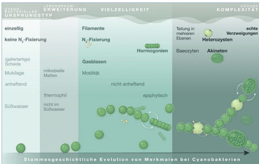
▲ Abb. 2: Stammesgeschichtliche Evolution von Merkmalen bei Cyanobakterien mit Fokus auf die Evolution von Vielzelligkeit [4]. Wir unterteilen die Reihenfolge der Merkmalsevolution in vier zeitliche Phasen: (i) der cyanobakterielle Ursprungstyp, (ii) Lebensraumerweiterung, (iii) Vielzelligkeit und (iv) höhere Komplexität.

fahren der Einzeller phänotypisch plastisch und heterogen gewesen sein. Sie verfügten wahrscheinlich über physiologisch inkompatible Funktionen und durchliefen während ihrer Lebenszyklen eine Vielzahl verschiedener Lebensstadien. In diesem Fall müsste der Verlauf der Evolution der differenzierten Vielzelligkeit neu gedacht werden ( Abb. 1 ): Die Zellen der ersten vielzelligen Einheiten wären bereits in der Lage gewesen, sich in eine Reihe verschiedener Zelltypen zu differenzieren, ähnlich wie moderne Stammzellen. Somit hätten diese neuen Entitäten sofort von einer funktionellen Komplementierung profitieren können.