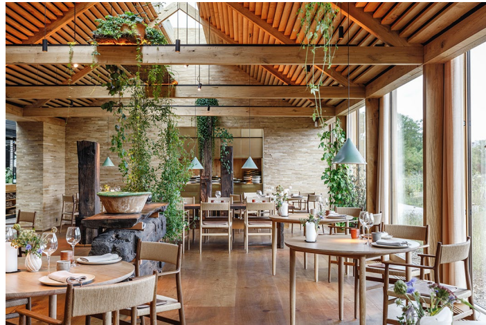
Nomas spisehus til gæster

are closely related but visually diverse variations of the same type«. 27 Omkranset af et haveanlæg med vilde nordiske planter er der således med udgangspunkt i et bevaringsværdigt søminedepot skabt et lille community med i alt 11 glasgangsforbundne produktions-, forråds-, rekreations- og spisehuse, hvoraf det største, spisehuset til gæster, minder om en lade ved at være et rektangulært rum beklædt med massive egetræsplanker både ud- og indvendigt og have loft til kip. Tagryggen er dog åbnet af en glaskile, ligesom der i den ene langside mod vandet er store vinduesfag, hvorved rummet på én gang accentuerer en fornemmelse af beskyttelse og åbenhed mod omgivelserne. 28