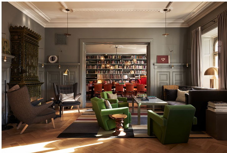
Udsnit af Ett Hems køkken og opholdsstue