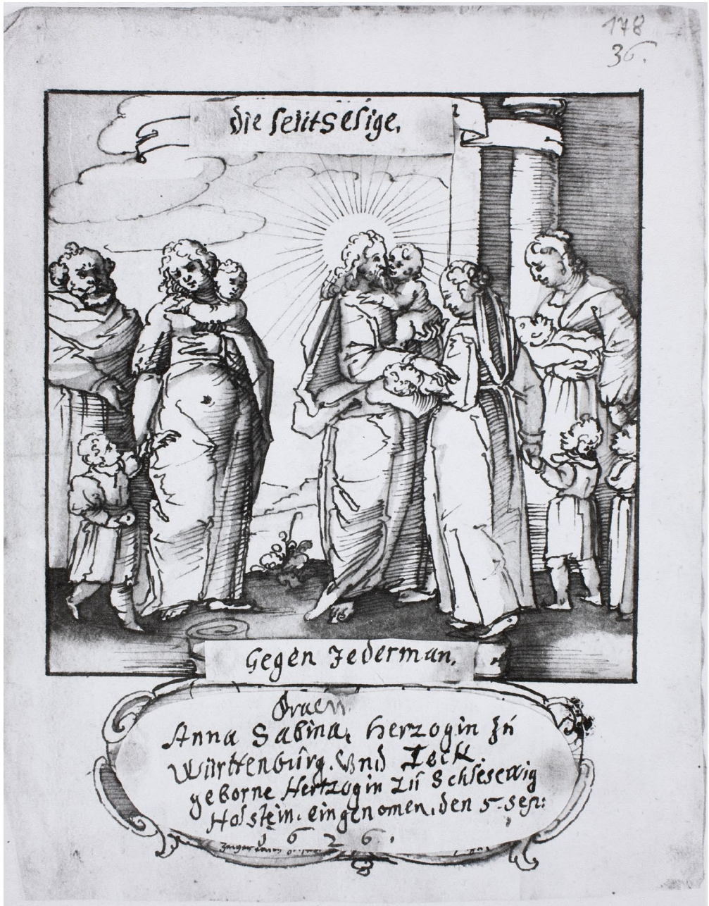
Abb. 2: Gemälde der Leutseligen. © Forschungsbibliothek Gotha, Chart. B 831ba (2), Bl. 178r.