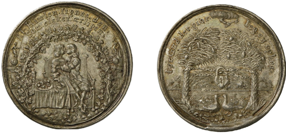
Abb. 3: Af Himlen tignes den som elsker ærligen for Gud det gjor leg ey ophor.