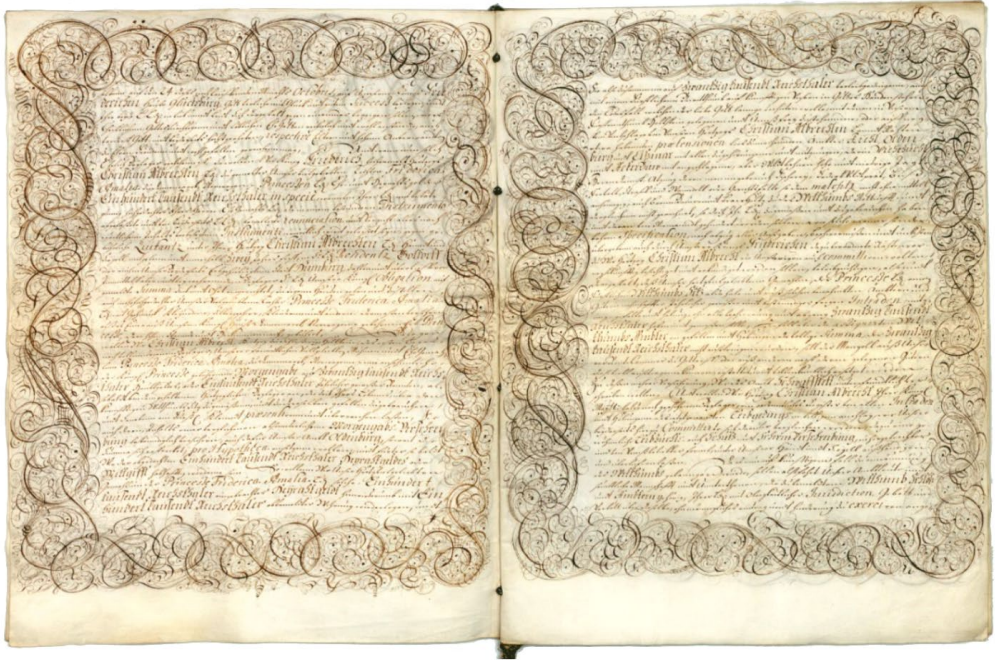
Abb. 2: Ehevertrag von Friederike Amalie und Christian Albrecht vom 23. Oktober 1667. © Landesarchiv Schleswig-Holstein, Urk.-Abt. 7, Nr. 102.

Unsere Ambtleute und sämbtliche Mannschafft und Underthanen, die zu bemeldten Wittthumb Schloß und Ambtern gehörig, Ihrer Ld: mit Obrigkeitlicher Jurisdiction. Gebott und Verbott über dieselbe ohn männliches eintrag und hinderung zu exerciren ange = wiesen werden, und derselben schweren [= schwören] und huldigen, damit Sie alsonach Ihrer Ld: und sonst Niemandt anders, sich zu halten und zurichten haben [...].