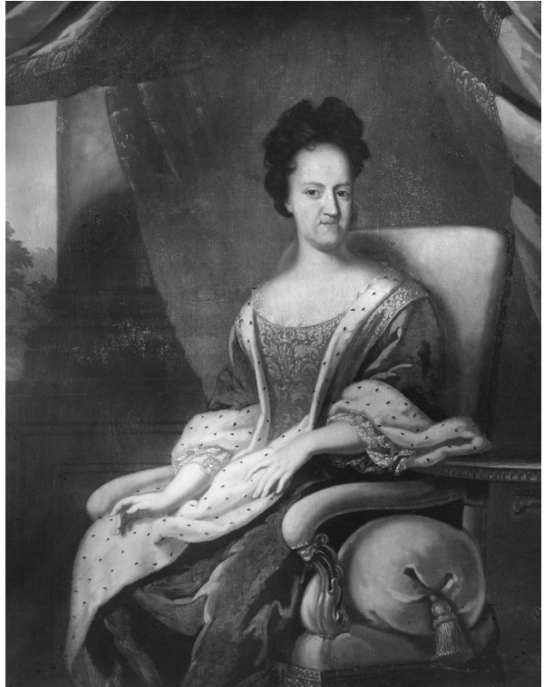
Abb. 5: Friederike Amalie, Gemälde von David von Krafft. © Schwedisches Nationalmuseum, Schloss Gripsholm, NMGrh 1339, veröffentlicht unter der Lizenz CC BY-SA 4.0 .

freundliche Politik Christian Albrechts fort und festigte im Sommer 1698 die schwedisch-gottorfische Allianz durch ein eheliches Band mit seiner Cousine Hedwig Sophie. 62