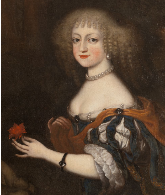
Abb. 1: Friederike Amalie, Gemälde von Jürgens Ovens. © Foto: Hans Thorwid; Schwedisches Nationalmuseum, Schloss Gripsholm, NMGrh 1259 , veröffentlicht unter der Lizenz CC BY-SA 4.0 .

Mitglied ihrer Herkunfts- und Ankunftsdynastie agierte und inwieweit sie Einfluss auf die dynastisch-politischen Beziehungen der nordischen Hegemonialmächte Dänemark-Norwegen, Schweden und dem Fürstenhaus Gottorf hatte, wird nachfolgend skizziert.