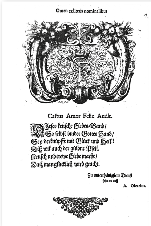
Abb. 4: Gedicht anlässlich der Eheschließung, verfasst von Adam Olearius.