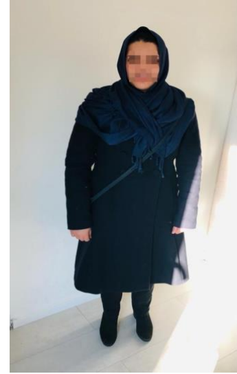
Abbildung 2: Locker drapiertes Kopftuch