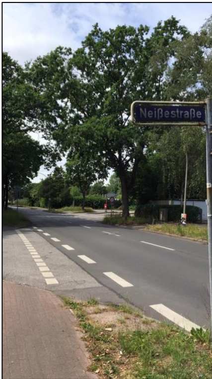
Abbildung 9: Raumerleben auf der Straße

Nachdem die Herausforderungen für kopftuchtragende Muslimas in der Bahn als topophob empfundener Raum eingehend untersucht wurde, wird in diesem vorliegenden Unterpunkt ein weiterer häufig als topophob wahrgenommener und dokumentierter Ort analysiert: die Straße. Dabei wird insbesondere auf die spezifischen Herausforderungen eingegangen, mit denen kopftuchtragende Muslimas im Alltag auf der Straße konfrontiert werden. Straßen sind ein wesentlicher Bestandteil des urbanen Alltags, die nicht nur für den Fahrzeugverkehr genutzt, sondern auch intensiv von Fußgängern frequentiert werden. Ihre Struktur kann stark variieren und reicht von breiten Hauptstraßen bis zu engen Gassen. Da eine Vielzahl von Straßenarten, wie Wohn-, Einkaufsstraßen und Fußgängerzonen existiert, würde eine detaillierte Betrachtung aller Typen den Rahmen dieses Abschnitts sprengen. Daher wird sich nachfolgend vorrangig auf solche Straßenarten konzentriert, die im Alltagsleben der kopftuchtragenden Muslimas von Bedeutung sind. Hierzu zählen insbesondere Haupt- und Einkaufsstraßen, die durch ihre hohe Frequentierung und Offenheit für spontane soziale Begegnungen prägnant sind. Auch weniger genutzte Wege, wie Wohn- und Nebenstraßen, spielen in den Erfahrungen der Probandinnen eine Rolle.