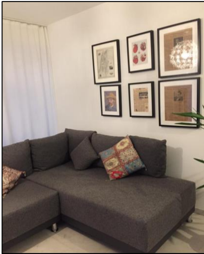
Abbildung 12: Raumerleben Zuhause

Das Zuhause ist für viele Menschen ein Ort im Alltag, der eine große persönliche Bedeutung hat. Der private Raum bietet Sicherheit und Schutz und stellt einen Bereich dar, in dem der Individualität freien Lauf gelassen werden kann. Jedoch können mit dem Zuhause auch negative Bedeutungen verknüpft sein. Dieser Raum kann beispielsweise für Menschen isolierend wirken, einen Mangel an Privatsphäre aufweisen oder aufgrund von häuslicher Gewalt ein Ort des Leids und der Unsicherheit sein. Der Wohnort kann stark variieren und sich je nach geographischer Lage entweder städtisch oder ländlich präsentieren. Die Präferenzen hinsichtlich des Wohnraumes sind rein subjektiver Natur. Dessen Größe kann von großzügig bis kompakt reichen, die Art des Wohngebäudes variiert von Einfamilienhäusern über Wohnungen bis hin zu Wohngemeinschaften. Auch die Gestaltung der Innenräume orientiert sich an den individuellen Vorlieben. Typischerweise besteht ein Wohnbereich aus einem Schlafzimmer, einem Wohnzimmer, einer Küche und einem Bad.