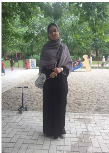
Abbildung 5: Kopftuch-Abaya-Code