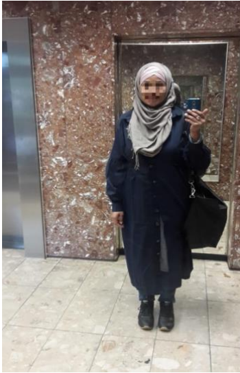
Abbildung 4: Vorne gebundenes Kopftuch