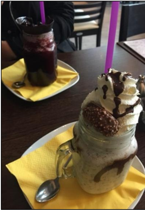
Abbildung 10: Raumerleben im Café

Das Café wird von den Probandinnen als ein topoambivalent empfundener Ort beschrieben. Es ist durch eine meist ungezwungene und entspannte Atmosphäre gekennzeichnet. Im Vergleich zu obligatorischen Aufenthaltsorten wie Straßen und öffentlichen Verkehrsmitteln ist das Café ein Ort, der nach subjektiven Vorlieben, Bedürfnissen und der Aufenthaltsdauer gewählt wird. Dabei lassen sich verschiedene Arten von Cafés unterscheiden, darunter gastronomische, Familien-, Arbeits- oder Themen-Cafés. Auch die Lage der Cafés kann stark variieren und reicht von zentralen, belebten Plätzen bis hin zu ruhigeren, abgelegenen Orten. Cafés können