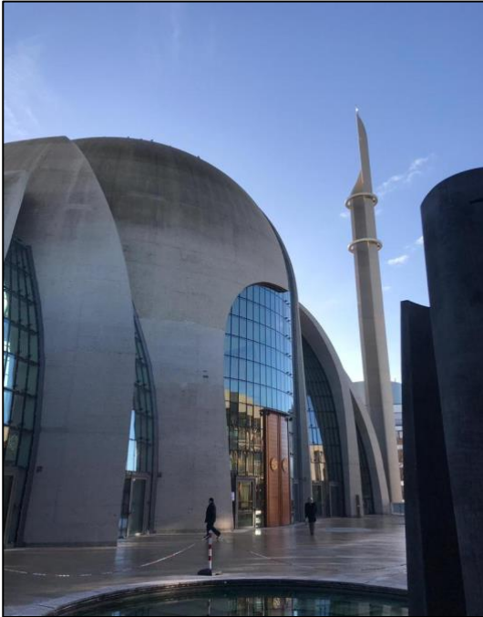
Abbildung 13: Raumerleben in der Moschee

Die Moschee dient als Gebetsraum für Muslime und wird von den Anhängern des Islams nicht nur für individuelles und gemeinschaftliches Gebet genutzt, sondern auch zum Lesen des Korans, für religiöse Veranstaltungen und als sozialer Treffpunkt. Die Größen und Formen von Moscheen variieren erheblich. Sie reichen von großen, imposanten Bauwerken bis hin zu kleinen, bescheidenen Gebäuden. Typischerweise zeichnen sich Moscheen durch bestimmte architektonische Merkmale wie Minarette, Kuppeln und offene Gebetsräume aus. In Deutschland sind prächtige Moscheen eher selten. Der Bau von Kuppeln und