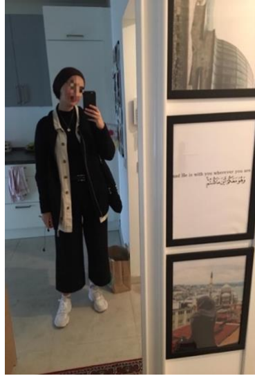
Abbildung 3: Hinten gebundenes Kopftuch