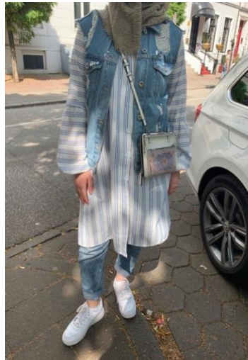
Abbildung 6: Kopftuch-Jeans-Code