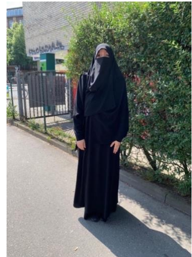
Abbildung 7: Niqab