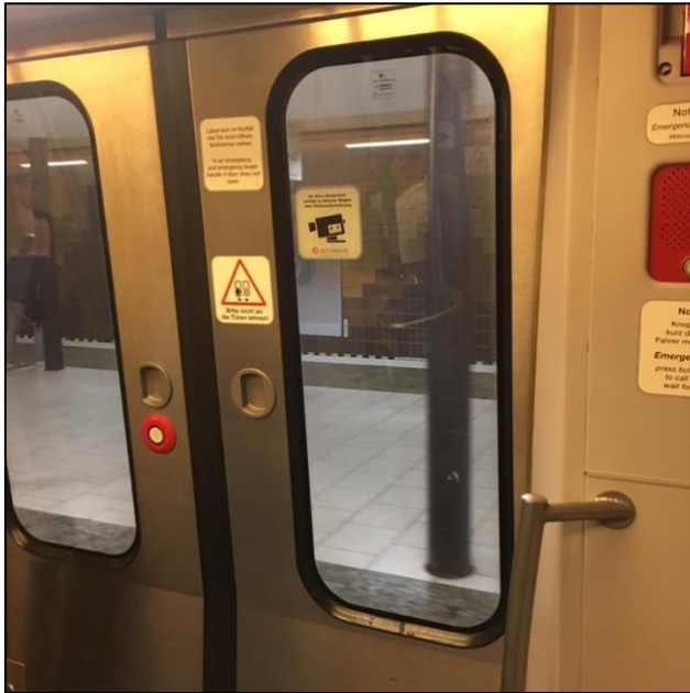
Abbildung 8: Raumerleben in der Bahn

Die Bahn ist ein öffentliches Verkehrsmittel, das in Deutschland seit 1835 zur Beförderung von Menschen eingesetzt wird. Dabei kann zwischen S-Bahn, U-Bahn, Regionalbahn und Fernzug unterschieden werden. Die Raumstruktur variiert je nach Art der Bahn. S- und U-Bahn bestehen überwiegend aus mehreren aneinandergereihten Wagen mit Sitz- und Stehplätzen, wobei die Sitzplätze größtenteils in Gruppen von zwei