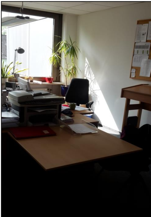
Abbildung 11: Raumerleben am Arbeitsplatz

Der Arbeitsplatz ist ein zentraler Ort im Leben vieler Menschen, an dem sie oft zahlreiche Stunden verbringen. Er bildet den Rahmen für die Ausübung beruflicher Tätigkeiten und ist häufig von sozialen Begegnungen geprägt. Der Arbeitsort kann dabei stark variieren und reicht vom Homeoffice über ein Großraumbüro oder eine Werkstatt bis hin zur Baustelle. Grundsätzlich kann die Arbeitswelt in die zwei Hauptkategorien „Selbstständigkeit“ und „Angestelltenverhältnis“ unterteilt werden. Während Selbstständige die Freiheit haben, den Arbeitsort, die Arbeitsweise und die Arbeitsdauer selbst zu bestimmen, sind Angestellte in der Regel an die Bedingungen ihres Arbeitgebers gebunden. Der Arbeitsplatz ist häufig durch verschiedene soziale Interaktionen geprägt, die erheblich zur Arbeitsatmosphäre beitragen können – sei es positiv oder negativ. Einige Arbeitsplätze erfordern selbstständiges Arbeiten, während andere auf Teamwork oder eine Kombination beider Arbeitsweisen ausgerichtet sind. In Deutschland ist das Arbeitsverhältnis gesetzlich geregelt und schafft eine rechtliche Grundlage für ein sicheres und gerechtes Arbeitsumfeld. Diese gesetzlichen Bestimmungen sind theoretisch darauf ausgerichtet, die Rechte der Arbeitnehmer zu schützen.