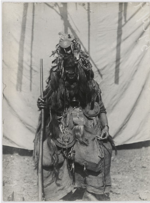
Abb.3: Eine Autorität der Poro mit metallener Glocke, fotografiert durch einen britischen Kolonialbeamten in Sierra Leone. Cambridge Museum, NWT Collection, P.33578 .