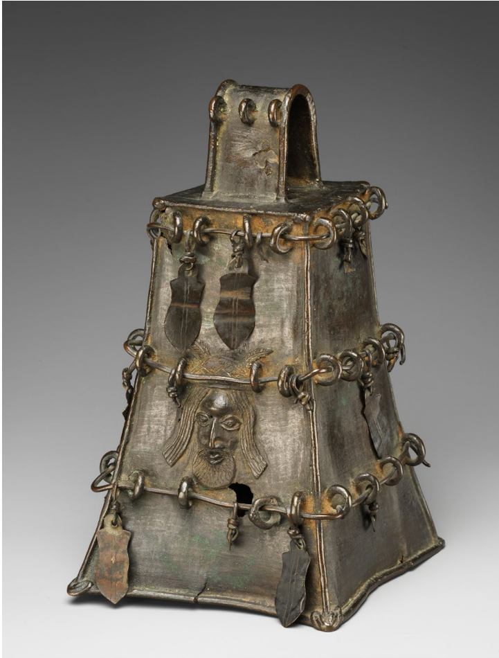
Abb. 1: Diese Glocke aus dem Palast des Königreiches Benin (16./17. Jh.) zeigt einen Portugiesen.

Besitzern vom deutschen Kolonialmilitär geraubt worden war, 37 zeigt eine solche Schiffsglocke als Dekoration und Glücksbringer in einem regionalen Bootsrennen (Abb. 2). Hier diente die Glocke als Dekoration und Glücksbringer am Schiffsschnabel eines langen Einbaum-Kanus für regionale Bootsrennen und abermals als Repräsentation der Handelsverbindungen nach Europa – neben anderen »europäischen Motiven wie etwa Kanonenrohr, Gewehr, [...] Petroleumlampe, Schnapsflasche und -gläschen sowie westlichen bunten wasserfesten Ölfarben.« 38 Im frühneu-