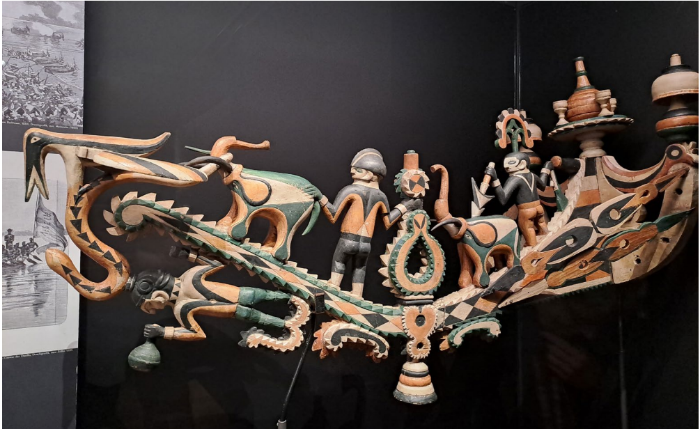
Abb. 2: Schiffschnabel aus Südkamerun (Duala) mit Holzglocke (19. Jh.). Museum Fünf Kontinente, München, Objekt-nummer 7087.

zeitlichen Westafrika schätzten die indigenen Eliten alte und neue Glockenklänge zunächst offenbar nebeneinander und für religiöse Rituale konnte man bei Bedarf weit weg von den Handelsschiffen Ruhe finden oder die Handelspartner gezielt zur Ruhe auffordern. Dies änderte sich mit den vielen Missionsschulen und -kirchen, die im späten 19. Jahrhundert afrikanische Städte und Dörfer mit ihren Glocken und den zugehörigen Normen beeinflussten.