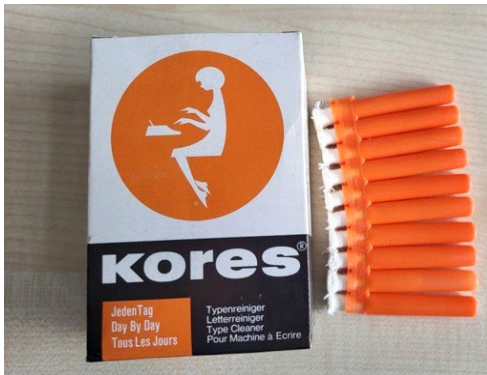
← Abb. 4. Der Typenreiniger »Jeden Tag« zur Reinigung des Typensatzes einer Schreibmaschine.

Beide Produkte dürften heute bei den meisten längst in Vergessenheit geraten sein und mit hin einfach kurios erscheinen; längst ist der omniprésente Computer von keinem Büroschreibtisch mehr wegzudenken, keine (häufig unleserlichen) Professoren-Manuskripte müssen mehr von anderen entziffert und abgetippt werden und die damals übliche briefliche Kommunikation ist fast vollständig durch Emailverkehr ersetzt. Jedoch fragt man sich schon, so formulierte Petersen nicht zuletzt mit Blick auf die radikalen Veränderungen der Wissenschaftspraxis, die sich möglicherweise durch die Weiterentwicklung von KI-Programmen ergeben könnten, über welche unserer Arbeitsweisen die Menschen dann in 25 Jahren, wenn das 175. Jubiläum des Germanistischen Seminars ansteht, werden schmutzeln müssen.