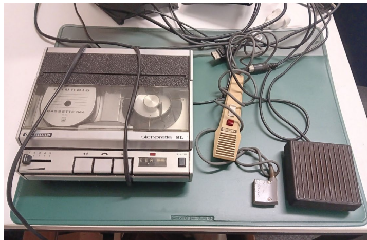
→ Abb. 3. Die Stenorette – einst Alltagshilfsmittel der Sekretariate.

neben anderen wichtigen Daten wie Angaben von Schreiborten und Abfassungsdatierungen – die Namen der mittelalterlichen Schreiberinnen und Schreiber ein entscheidendes Erfassungskriterium dar.