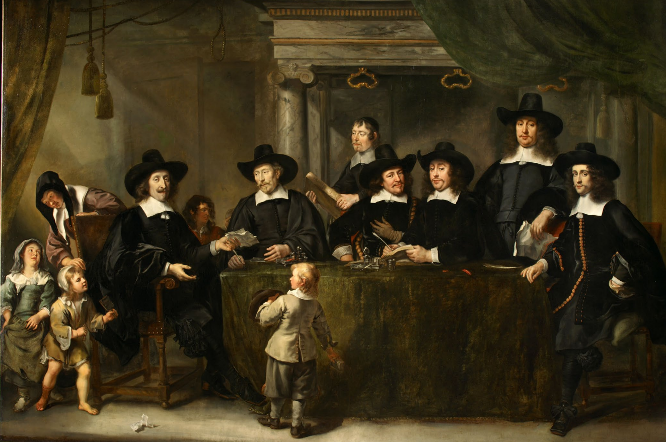
Abb. 7: Jürgen Ovens, Die Regenten des Amsterdamer Burgerweeshuis , 1663, Öl auf Leinwand, 257 x 401 cm. Gemeinfrei . Amsterdam Museum, Inv. SB 4843 .

Verzögerung wieder aufgenommen, Resultat ist Backers Gemälde von 1683. Es verging demnach fast ein halbes Jahrhundert zwischen Gründung des Collegiums und dem ersten Gruppenbildnis. 35 Middelkoop weist auf die Vermutung A. C. Stils hin, Anlass für Backers Porträt sei die Neugründung des Hortus Medicus (später Hortus Botanicus) 1682 gewesen. 36 Die Entwürfe Ovens' belegen, dass schon früher ein Gruppenporträt in Auftrag gegeben werden sollte und der Garten, wenn auch seinerzeit womöglich nicht mehr im besten Zustand, 37 programmatischer Bestandteil der Komposition war. Womöglich war die Neugründung des Hortus Anstoß, alte Pläne wieder aufzugreifen.