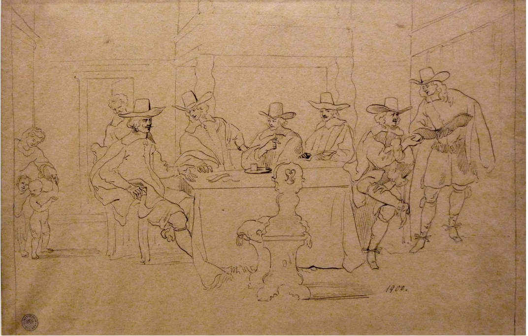
Abb. 8: Jürgen Ovens, Die Regenten des Amsterdamer Burgerweeshuis , Feder auf Papier, 32 x 50,8 cm. Kunsthalle Bremen, Kupferstichkabinett, Inv. 1900.

die dadurch mehr als ein Attribut sind, als das sie in anderen Regentenstücken der Waisenhäuser erscheinen. 39 Dieses Großformat mag dem Collegium Medicum als Referenz gedient haben. Die erhaltenen Quellen zur Entstehung verraten außerdem exemplarisch etwas über den Ablauf: Alle dargestellten Regenten fanden sich nach und nach im Atelier Ovens' ein und bezahlten ihren Anteil, nachdem sie seine Arbeit abgenommen hatten. 40 In den beiden Skizzen zum Gemälde (Abb. 8) findet sich anstelle des Jungen im Vordergrund noch ein leerer Stuhl, die geschnörkelte Lehne zu den Betrachtenden gewandt. 41 Diese kompositorische Barriere wurde in der Malerei zugunsten des Narrativs eines Neuankömmlings verworfen, Ovens griff die Idee aber für das Gruppenporträt des Collegium Medicum wieder auf. Das Regentenstück hängt bis heute an seinem Bestimmungsort, in der Regentenkamer des ehemaligen Waisenhauses, heute Amsterdam Museum.