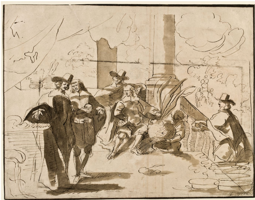
Abb. 4: Jürgen Ovens, Die Inspektoren des Collegium Medicum, ca. 1663–75, lavierte Feder über Bleistift, 30 x 35,3 cm. Kunstsammlungen der Veste Coburg, Kupferstichkabinett, Inv. Z.2688.