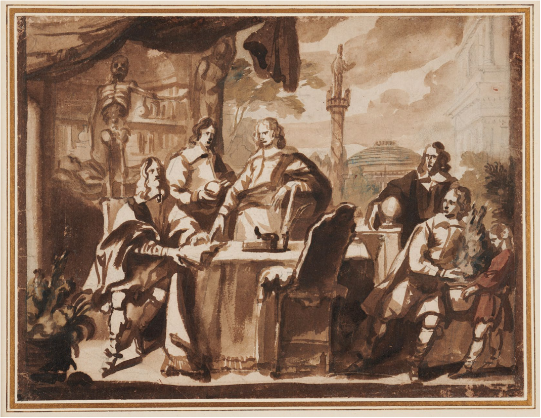
Abb. 2: Jürgen Ovens, Die Inspektoren des Collegium Medicum, ca. 1663–75, Pinselzeichnung auf Papier, 20,7 x 28,3 cm. © Ashmolean Museum, University of Oxford, Inv. WA1936.162 .

schaft mit Architektur im Hintergrund öffnet. Bemerkenswert ist das menschliche Skelett vor dem Bücherregal, das seinen linken Arm wie auf die Gruppe weisend hebt. Unbestimmbar ist die äußerst summarisch dargestellte Pflanze mit federig aufsteigenden Blättern, die das Kind rechts einem der Männer bringt. Der mit der Lehne zu den Betrachtenden gewandte leere Stuhl ist aus dem Entwurf für ein weiteres Regentenstück bekannt, wurde aber nicht in das Gemälde übernommen (s. u.).