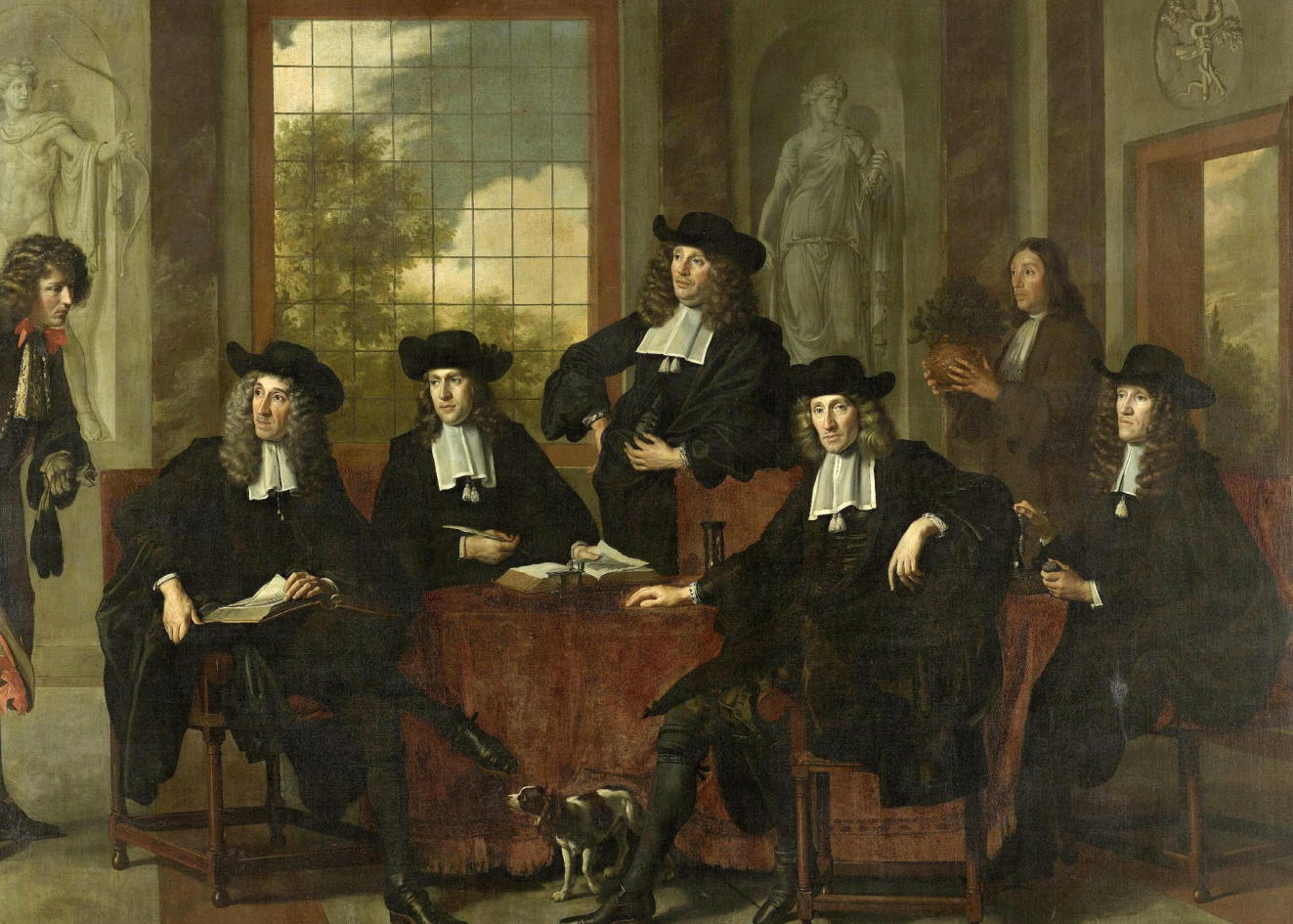
Abb. 5: Adriaen Backer, Die Inspektoren des Collegium Medicum, 1683, Öl auf Leinwand, 261 x 378 cm. Gemeinfrei . Amsterdam Museum, Inv. SA 7282, als Dauerleihgabe im Rijksmuseum Amsterdam, Inv. SK-C-360 .

beschränkt fühlten. 12 Die Apotheker und Ärzte verpflichteten sich zu gemeinsamem Arbeiten und gutem kollegialem Auskommen. So heißt es in Regelungen, die der Gründung 1638 vorausgingen, »Medizinmeister und Apotheker sollen in guter Freundschaft [...] die Kranken versorgen, ohne dass einer den anderen verachte«, 13 die Apotheker hatten bei regelmäßigen Inspektionen ohne »Murren« mitzuarbeiten etc. 14 Vor allem aber wurde die Arbeit reglementiert, Zuständigkeiten unterschieden, Vorgaben zur Herstellung von Arzneien und zur Behandlung von Kranken festgelegt. Beispielsweise durften Ärzte keine Medikamente herstellen, sondern ausschließlich Apotheker. 15