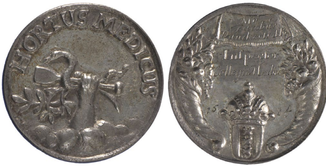
Abb. 6: Toegangspenning Jacobus Dankertsz. De Rij, 1684, Silber, Durchmesser 3,7 cm. Gemeinfrei. Amsterdam Museum, Inv. PA 31.

(Abb. 6). 26 Er zeigt das Wappen des Collegium Medicum, wie es auch in Backers Gemälde über der Tür erscheint. 27