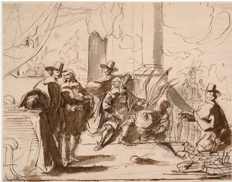
Abb. 3: Jürgen Ovens, Die Inspektoren des Collegium Medicum, ca. 1663–75, lavierte Feder über Bleistift auf Papier, 27,7 x 34,6 cm. Statens Museum for Kunst, Kongelige Kobberstiksamling, Inv. KKSgb6705 .