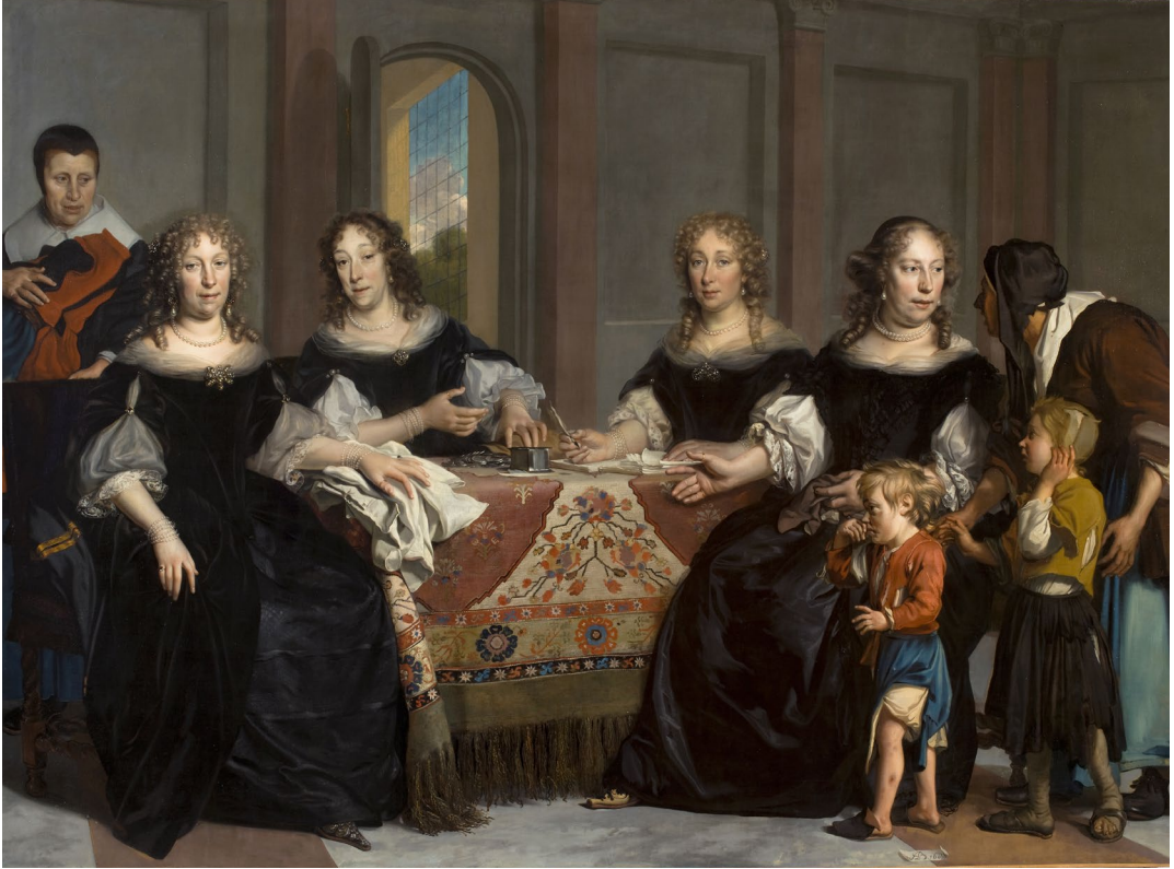
Abb. 9: Adriaen Backer, Die Regentessen des Burgerweeshuis , 1683, Öl auf Leinwand, 193 x 282 cm. Gemeinfrei . Amsterdam Museum, Inv. SB 4844 .

Jacob Adriaensz. Backers von 1663–34 gegenüber des Regentenstücks Abraham des Vries' von 1633 bildete es eine Art Pendant zu Ovens' Arbeit, wenn auch nicht mehr im selben Raum. 52 Ein weiterer Berührungspunkt, der zur Wahl Backers für das Gruppenporträt des Collegium Medicum beigetragen haben mag. 1670 hatte Backer bereits eine Anatomiestunde des Frederick Ruysch gemalt (1683 malte Jan van Neck eine weitere). 53