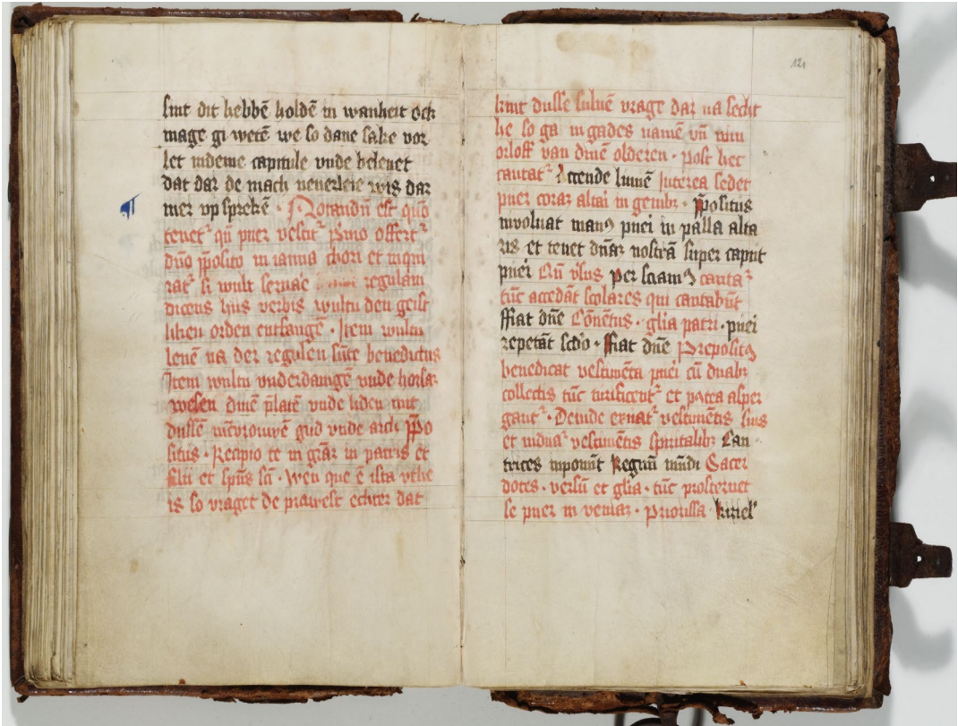
Abb. 1: Buch im Chore , fol. 120v und 121r. Adeliges Kloster Preetz, Klosterarchiv, VII B. Alle Rechte vorbehalten.

Was nun das Buch im Chore auf fol. 120v–122r bietet, ist weder eine Novizinnen-Einkleidung noch eine Profess, sondern vielmehr eine Art »Einkleidung mit Oblation« – am Anfang des Textes steht ganz ausdrücklich: »Primo offertur [puer] domino preposito in ianua chori«, das Kind wird also »dargebracht«, und zwar von seinen Eltern, wie im Folgenden zu erkennen ist, denn der Propst fordert es auf: »nim orloff van dinen olderen«. Diese Darbringung findet offensichtlich vor dem Hochaltar im Sanktuarium statt, also in dem freien, für Laien zugänglichen Raum zwischen dem Hochaltar und dem Nonnenchor, der sich zu Preetz westlich davon ebenerdig im Kirchenschiff befand – vielleicht ist mit der ianua chori schon die Pforte der neuen östlichen Begrenzungsmauer des Nonnenchores gemeint, die Anna von Buchwald errichten ließ, an der Stelle, wo sich heute das barocke Chorgitter befindet. 24 Nun kniet das Kind vor dem Altar und der Propst hüllt seine Hände in ein Corporale, also das Leinentuch, auf dem während der Zelebration der Messe die Hostie liegt: Prepositus involvat manus pueri in palla altaris . Das aber ist nichts anderes als der konstitutive Gestus der Oblation, 25 so wie sie einst in cap. 59 der Benediktsregel zu finden war, tatsächlich hatte der Regel-Autor neben der Profess der erwachsenen Kandidaten nämlich