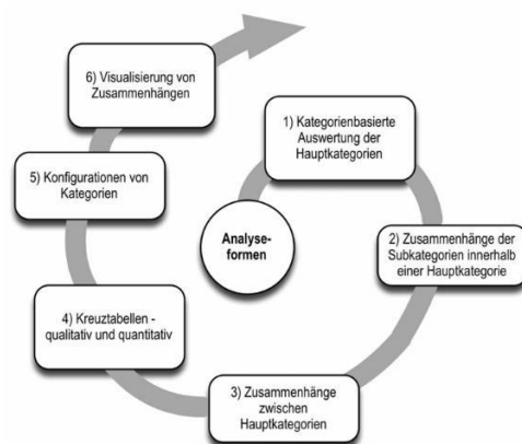
Abbildung 2: Sechs Formen einfacher und komplexer Auswertung bei einer inhaltlich strukturierenden Inhaltsanalyse (Kuckartz 2018, S. 118).

Anhand der folgenden Grafik werden die sechs Formen einfacher und komplexer Auswertung bei einer inhaltlich strukturierenden Inhaltsanalyse noch einmal dargestellt.